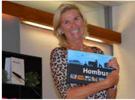
Hera Lind verstand es meisterhaft, ihr Publikum in den Bann zu ziehen

Diese Termine waren ein lebendiges Zeugnis dafür, dass Geschichten Menschen verbinden – ob von einem Bestsellerautor mit ironischem Augenzwinkern oder von Kindern, die ihre ersten eigenen Welten erschaffen. Fantasie kennt keine Grenzen, und die Homburger Schreibfeder ist der Beweis dafür, dass sie schon im jungen Alter Flügel verleiht.