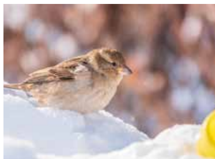
Die kleinen Vögel wie der Sperling trotzen der Kälte und freuen sich über einen geschützten Platz

Vögel nachlesen. Vielleicht wäre das mal eine gute Idee für die Winterzeit, fragt mal den Papa oder den Opa, die helfen euch sicherlich dabei. Man kann solche Futterhäuschen und Nistkästen übrigens auch wunderbar verschenken. Im Fachhandel kann man dann das entsprechende Futter