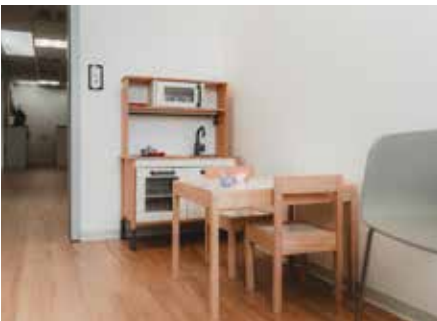
Für Kinder steht eine kindgerechte Spielecke zur Verfügung.

zept, eAU und eine KI-gestützte Telefonassistentin sorgen dafür, dass Bürokratie keinen Raum von der medizinischen Betreuung nimmt. Die lichtdurchfluteten Praxisräume, liebevoll gestaltet und funktional durchdacht, tragen zusätzlich zu einer angenehmen Atmosphäre bei – ein Wohlfühlort im oft turbulenten Gesundheitsalltag. Für die Zukunft setzt die Ärztin bewusst auf Wachstum – nicht im