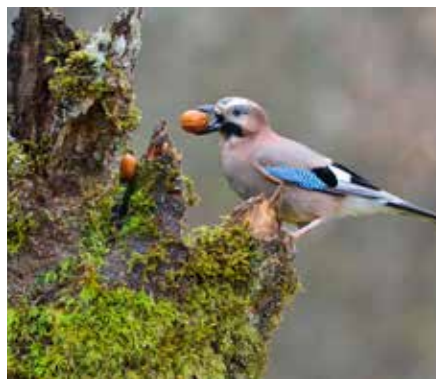
Auch der wunderschöne Eichelhäher ist ein Standvogel, der bei uns überwintert

im Frühjahr auch als Brutstätten gut machen. Diese bieten den Tieren einen warmen Unterschlupf und schützen vor Wind und Kälte. Eichhörnchen und Schmetterlinge nutzen auch gerne Nistkästen zum Überwintern. Wie man einen Nistkasten selbst bauen kann, könnt ihr unter www.nabu.de in der Rubrik Tiere & Pflanzen/