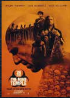
28 Years Later: The Bone Temple ab / am 15.01.2026