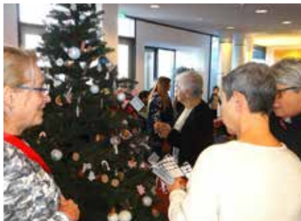
Mit der Unterstützung von netten KSK-Mitarbeiterinnen konnten Bewohnerinnen der Seniorenresidenz „Haus am Schlossberg“ ihre Wunschzettel am Weihnachtsbaum anbringen

Baum aufgebunden. Jeder Zettel trägt einen kleinen, persönlichen Weihnachtswunsch von Bewohnerinnen und Bewohnern der Seniorenresidenz „Haus am Schlossberg“ in Homburg, wie etwa ein warmer Schal, ein Lieblingsbuch oder Pralinen. Einige Bewohnerinnen und Bewohner der Residenz waren vor Ort, um beim Anbringen der Wunschzettel zu helfen und um wertvolle Momente mit den jungen Menschen zu teilen. So entstand gemeinsam ein lebendiger Ort des Austauschs, an dem Generationen zusammengekommen sind um Freude zu schenken und um einander zu