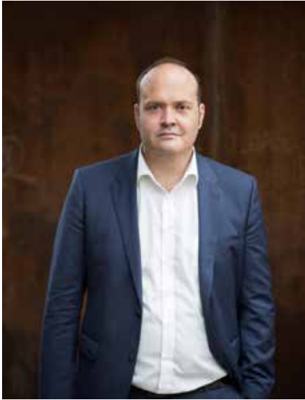
Bei der HomBuch stellte Robin Alexander nun sein neues Werk Letzte Chance vor – ein Buch, das den Nerv der Zeit trifft

wo er sich schnell einen Namen machte. 2013 wurde er mit dem renommierten Theodor-Wolff-Preis ausgezeichnet, ein Beleg für seine präzise und zugleich pointierte Art, Politik zu erklären. Heute ist er stellvertretender Chefredakteur Politik der Welt und einer der meistgelesenen politischen Kommentatoren des Landes. Mit seinen Büchern Die Getriebenen und