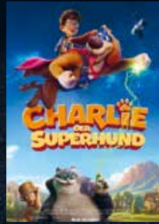
Charlie - Der Superhund ab / am 29.01.2026