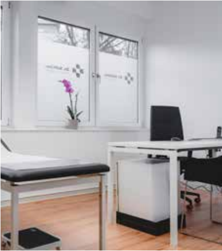
Heller, moderner Behandlungsraum – gestaltet für eine ruhige Atmosphäre und persönliche medizinische Betreuung.

zept, eAU und eine KI-gestützte Telefonassistentin sorgen dafür, dass Bürokratie keinen Raum von der medizinischen Betreuung nimmt. Die lichtdurchfluteten Praxisräume, liebevoll gestaltet und funktional durchdacht, tragen zusätzlich zu einer angenehmen Atmosphäre bei – ein Wohlfühlort im oft turbulenten Gesundheitsalltag. Für die Zukunft setzt die Ärztin bewusst auf Wachstum – nicht im