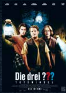
Die drei ??? - Toteninsel ab / am 22.01.2026