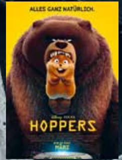
Hoppers ab / am 05.03.2026