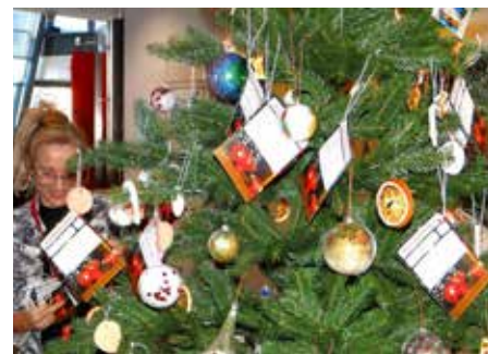
Jeder Wunschzettel beinhaltet einen kleinen, persönlichen Weihnachtswunsch von Bewohnerinnen und Bewohnern der Seniorenresidenz „Haus am Schlossberg“. Insgesamt 115 Wünsche fanden so ihren Platz am Weihnachtsbaum in der KSK-Geschäftsstelle

stärken. Nachdem der Tannenbaum festlich geschmückt und die Wunschzettel angebracht waren, war noch gemeinsam Zeit für einen Austausch zwischen Jung und Alt. Auch mit leckerem Weihnachtsgebäck hatte die KSK vorgesorgt. Was bedeutet diese Tannenbaum-Aktion für den vorweihnachtlichen Publikumsverkehr in der KSK-Geschäftsstelle? Ganz einfach: Wer möchte nimmt sich einen Wunschzettel vom Baum und besorgt das entsprechende Geschenk, das den Wunschzettel realisiert. Danach gibt man das entsprechende Ge-