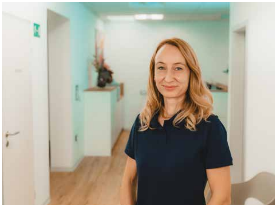
Die verantwortliche Hausärztin bringt in der neuen Praxis Erfahrung mit sich und bietet hausärztliche Versorgung nach modernen Standards in Homburg.

Vorsorgeuntersuchungen, Check-ups, Impfungen, Diagnostik und Behandlung akuter und chronischer Erkrankungen, Ultraschall, EKG, Langzeitblutdruckmessungen, Lungenfunktionstests sowie psychosomatische Grundversorgung. Prävention spielt dabei eine zentrale Rolle. Regelmäßige Gesundheitschecks, gezielte Beratungen zu Ernährung und Bewegung sowie Screening-Untersuchungen sind fest in den Praxisablauf integriert. Die Ärztin ist überzeugt: Wer gut informiert ist,