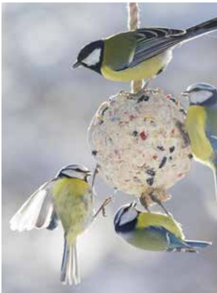
Blaumeisen und ihre Artgenossen laben sich gerne an den Meisenknödel.

Es sind doch einige der kleinen gefiederten Freunde, die der Kälte trotzen und ihre Heimat nicht verlassen. Zu ihnen gehören der Sperling, verschiedene Finkenarten, Amsel, Rotkehlchen, Eichelhäher, Blaumeisen, Spechte, Krähen und viele mehr. Diese Vögel nennt man alle Standvögel,