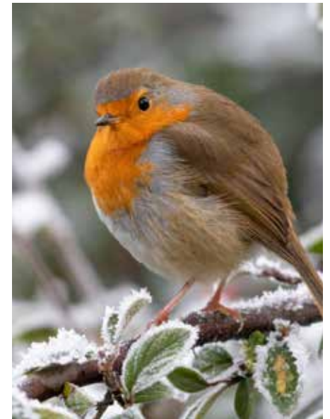
Das Rotkehlchen hat sich gegen die Kälte schön aufgeplustert

zum Brüten dort einziehen. Und nach der Brut im Spätsommer macht man den Nistkasten für den Winter sauber. Beim Vogelfutter gibt es Unterschiede, denn wir haben da die Weichfutterfresser, wie Rot-