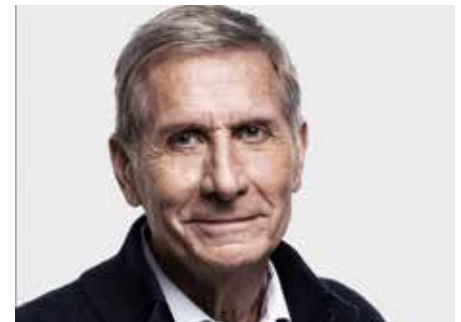
Der Abend mit Ulrich Wickert war ein Plädoyer für Freundschaft und Europa

Ulrich Wickert, 1942 in Tokio geboren, zählt zu den prägenden Stimmen des deutschen Journalismus. Bekannt wurde er durch seine kritischen Beiträge beim Fernsehmagazin MONITOR. Vierzehn Jahre lang berichtete er als ARD-Auslands-