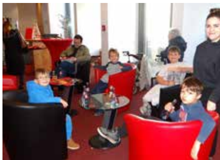
Schüler und Schülerinnen der Homburger Oberlin-Schule hatten sichtlich Spaß nicht nur beim Baumschmücken, sondern auch bei Limo und leckerem Weihnachtsgebäck

Ziel der KSK-Verantwortlichen ist es, mit dieser weihnachtlichen Aktivität Generationen zusammenzubringen und insbesondere Seniorinnen und Senioren in