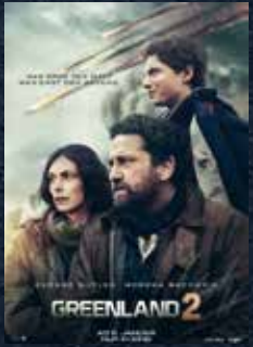
Greenland 2 ab / am 08.01.2026