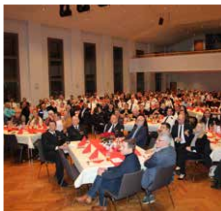
Blick in den gut besetzten Saal

und präsentierte dabei beeindruckende Daten zu Mitgliederzahlen, zur Jugendfeuerwehr, zu Einsätzen, Einsatzstunden und geretteten Personen aus allen Löschbezirken. Eckhardt sparte nicht mit Lob