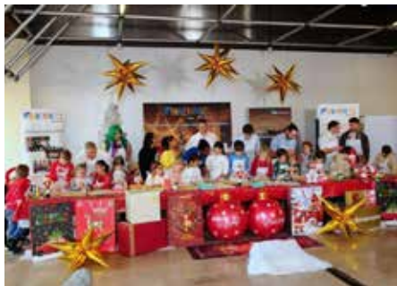
„Stars gegen kleine Weihnachtsbäcker“, die Backchallenge war wieder ein großartiger Spaß für alle

Nach dem großen Erfolg der ersten Backchallenge im vergangenen Jahr im Oh!lio war die Spannung groß – und sie wurde nicht enttäuscht. Mit Zuschauern vor Ort und einem Livestream, der viele Menschen erreichte, wurde die Veranstaltung zu einem lebendigen Zeichen dafür, wie viel man gemeinsam bewegen kann. Lei-