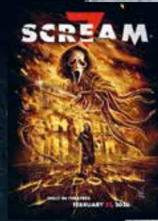
Scream 7 ab / am 26.02.2026