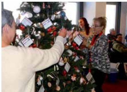
Der Baum war am Ende vollgepackt mit von den Kindern selbst gebasteltem Weihnachtsschmuck wie beispielsweise Sternen, Kugeln und Anhängern. Dazwischen die Wunschzettel der Senioren

Seniorenheimen, die über die Feiertage häufig einsam sind, mit der damit verbundenen Wunschzettel-Aktion mit einem