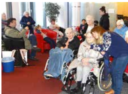
Aufmerksam verfolgten die älteren Teilnehmer das Geschehen bei der Wunschbaum-Aktion der Kreissparkasse Saarpfalz

kleinen, liebevollen Geschenk zu erfreuen. Los ging es am 17. November, als der Tannenbaum in der Geschäftsstelle der Kreissparkasse geschmückt wurde. Schülerinnen und Schüler der Homburger Oberlin-Schule verzierten den Baum mit selbstgebasteltem Schmuck, wie beispielsweise Sternen und Anhängern. Erstmals in diesem Jahr wurden auch Wunschzettel am