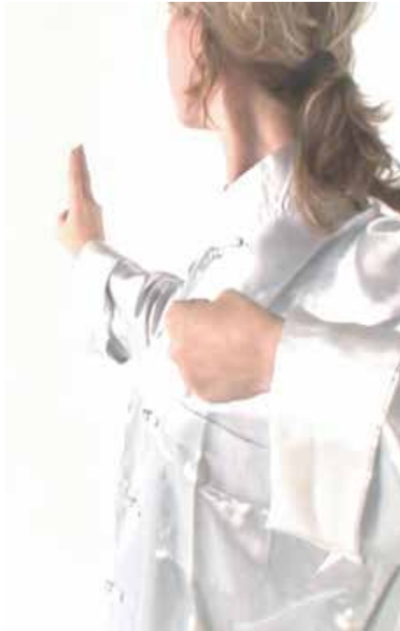
Entspannung und Aktivierung

Neben dem Erlernen grundlegender Bewegungen und Haltungsprinzipien im Taiji liegt der Schwerpunkt auf dem Thema Entspannung. Taiji hilft bei der Regulation von physischen und psychischen Stressreaktionen und dient somit der Erholung und Regeneration. Den Teilnehmenden werden konkret Möglichkeiten aufgezeigt, in Stresssituationen aktiv regulierend einzuwirken. Um eine Balance zwischen Regeneration und Aktivierung zu schaffen, wird zusätzlich eine kurze tägliche Routine eingeübt, die sowohl Kreislauf, Muskulatur, Faszienelastizität als auch die Rückengesundheit fördert. Der Kurs kostet 90,- Euro und ist von den Krankenkassen als Präventions-