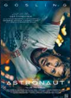
Der Astronaut - Project Hail Mary ab / am 19.03.2026