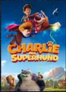
Charlie - Der Superhund in Kürze