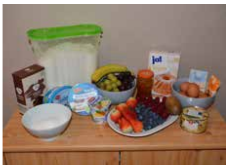
Diese Zutaten brauchen wir für die Frucht-Mascarpone-Schnitten