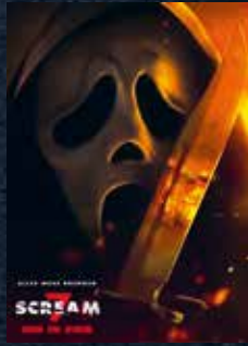
Scream 7 5. Woche!