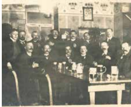
Schützengesellschaft Homburg