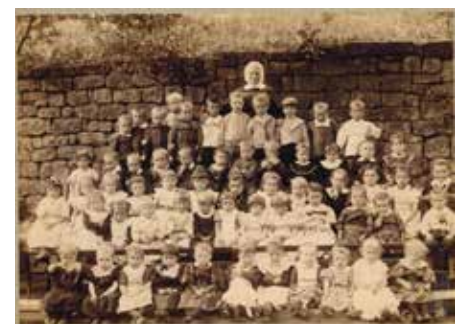
Evangelischer Kindergarten Homburg Bild von 1895