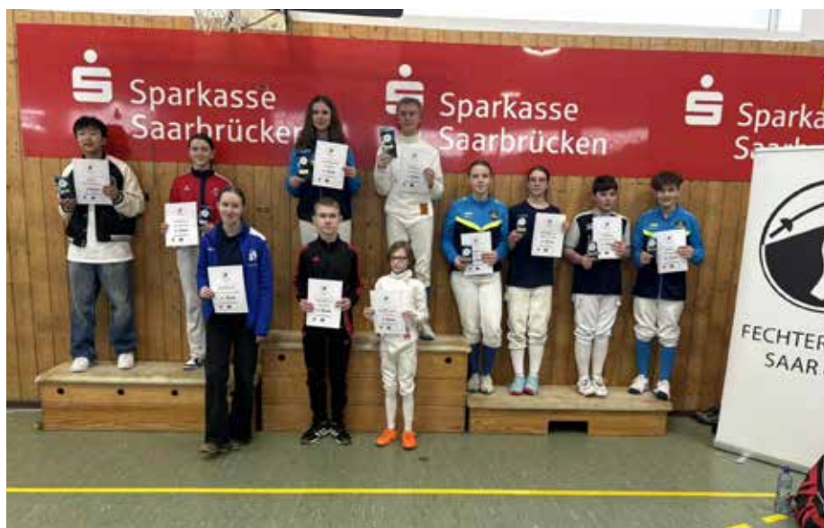
U15 Sieger DDG und HDG