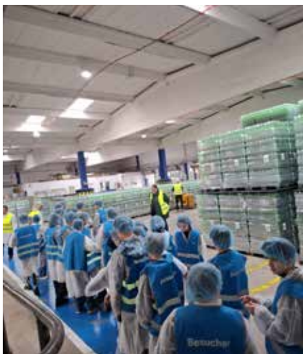
Besichtigung einer Lagerhalle

konnten die Schülerinnen und Schüler an sechs verschiedenen Stationen unterschiedliche Berufsfelder kennenlernen. Dazu gehörten unter anderem die Bereiche Schlosserei, Kfz-Werkstatt, Maurerhandwerk,