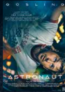
Der Astronaut - Project Hail Mary Jetzt bei uns!