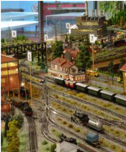
Kohlenwäsche (links), Bahnhof (Bildmitte) dahinter Kraftwerk Bexbach, Güterbahnhof Bexbach (rechts) und Grube Frankenholz (rechts, hinten)

den aufgeschüttet und formten jene Halde, die heute den Namen „Monte Barbara“ trägt. Auf ihrer Spitze wacht die Heilige