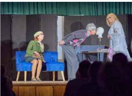
Loriot-Paartherapie - ein echter Knaller!

Steinwurf weit entfernt, das HAT (Homburger Amateur Theater) mit seiner dritten von insgesamt fünf Aufführungen des eingeübten Programms „LORIOTS dramatische Werke – die Ente bleibt draußen!“