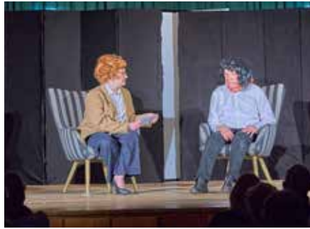
„...könnten Sie bitte mal ihre tolle Maske ausziehen - nur ganz kurz fürs Publikum“ ... „Äh, wie, was?“

wirklich auf eine harte Probe gestellt, wie unser Reporter nur zu gut bestätigen kann. Fünf Aufführungen, alle restlos ausverkauft – 190 Zuschauer pro Abend, die sich vor Lachen bogen. Das ist eine Ansage! Wenn zum Beispiel zwei Paare beim Sketch „Der Kosakenzipfel“ anfangen sich köstlich um eine im Grunde belanglose Kirsche zu streiten, was die Freundschaft dann letztlich entzweit und das ganze Geschehen