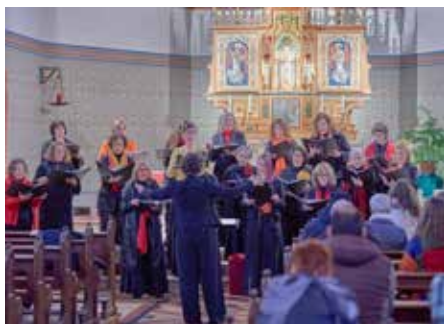
Der saarländische Frauenchor sang in der St. Andreas-Kirche, Homburg-Erbach

Geistlich und weltlich, ernst und humorvoll stellte das gut 90-minütige Konzert eine musikalische Reise durch Hoffnung, Schmerz, Schönheit und Lebensfreude dar und berührte, überraschte und inspirierte die anwesenden Gäste. Der Saarländische