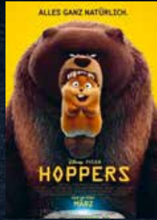
Hoppers 4. Woche!