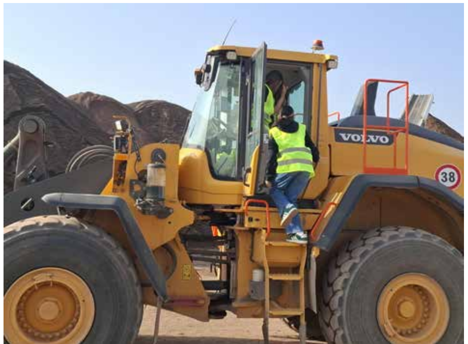
Spannend war auch der Besuch bei der Alois Omlor GmbH in Homburg.

keiten eines Berufskraftfahrers, eines Kfz-Mechatronikers sowie einer Industriekauf-frau und konnten Fragen zu Ausbildung und Arbeitsalltag stellen. Darüber hinaus besuchten die Klassen den Produktionsstandort der Mitteldeutschen Erfrischungsgetränke Gruppe (MEG) der Schwarz-Gruppe in Kirkel. Neben einer Führung durch die Produktion und die Lagerlogistik