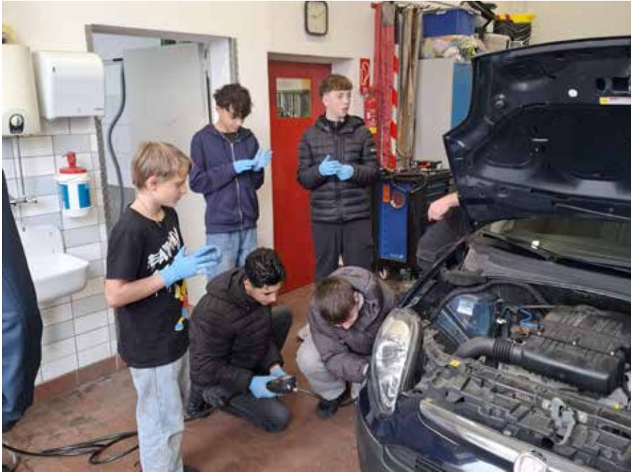
Einmal Reifen wechseln bitte!