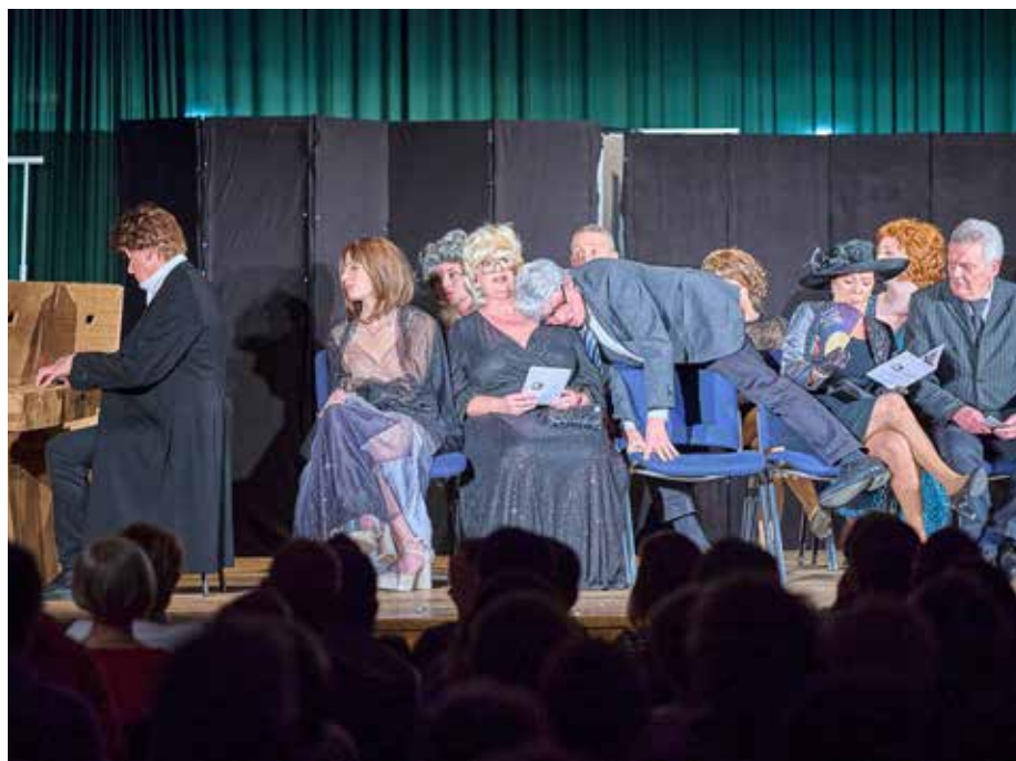
Schallendes Gelächter seitens des Publikums war garantiert bei den vielen Lorient-Sketchen im Thomas Morus-Haus

faszinierend zu beobachten, wie der Chor den Spagat zwischen geistlicher Tiefe und moderner Lebensfreude meisterte. Da war dieses tiefe, dankbare „For the beauty of the earth“ von John Rutter, das perfekt in die sakrale Akustik passte. Aber dann –