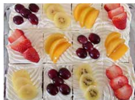
Natürlich könnt ihr den Kuchen ganz nach euren Vorlieben belegen

gestellt. Sicher schafft ihr es auch ein Bild zu legen wie bei unserer Vorgabe.