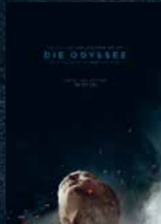
Die Odyssee ab / am 16.07.2026