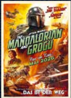
The Mandalorian und Grogu ab / am 20.05.2026