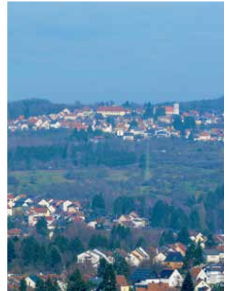
Herrlich ist der Ausblick vom Hindenburgturm, hier auf Höchen

zeigt eine echte Einfahrt in die Grube Ens-dorf – so realistisch, dass man unwillkürlich den Atem anhält. Für einen Augenblick fühlt man sich wie ein Bergmann, der zur Schicht einfährt. Unten angekommen, erwartet die Besucher eine Welt, die sonst verborgen bleibt: enge Stollen, Maschinen, Geräusche, Licht und Schatten. Man bekommt eine Ahnung davon, wie hart, gefährlich und gleichzeitig bedeutend die Arbeit der Bergleute war. Es ist ein Erlebnis, das Respekt weckt – und Dankbarkeit. Doch das Museum hat noch mehr