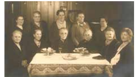
Kaffeekränzchen