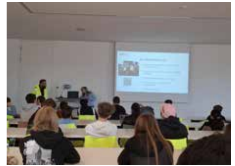
Die Betriebe nahmen sich viel Zeit.