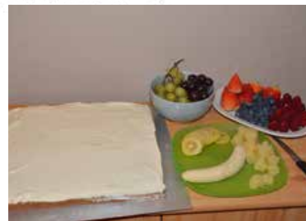
Nun könnt ihr beim Belegen eurer Fantasie freien Lauf lassen

marmelade macht ihr im Topf oder schnell in der Mikrowelle heiß, so dass sie flüssig wird. Dann streicht ihr sie auf den Kuchen. Nun schneidet ihr euch euer Obst zurecht, hierbei ist alles erlaubt, was euch schmeckt. Wenn ihr alles vorbereitet habt, streicht ihr die Creme auf den Kuchen. Nun kann das Belegen los gehen. Ihr könnt das auf verschiedene Art und Weisen tun, wir haben euch mal zwei Beispiele bereit-