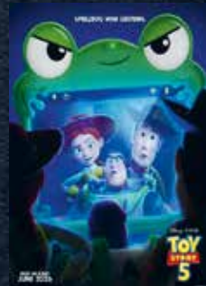
Toy Story 5 ab / am 18.06.2026