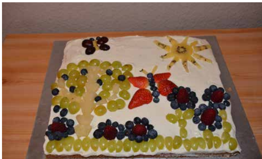
Wir haben aus Obst ein Bild auf den Kuchen gelegt

Viel Spaß beim Nachbacken und lasst euch den Kuchen schmecken. se