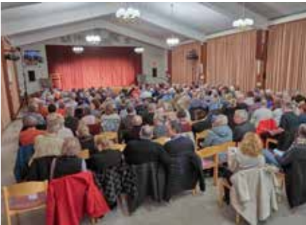
Volles Thomas Morus Haus - und das bei 5 Theateraufführungen der HAT (Homburger Amateur Theater)

am Sonntag, dem 15. März. Da singt der Chor nämlich um 17 Uhr sein Programm erneut im Kuppelsaal Wemmetsweiler in 66589 Merchweiler. Weitere Informationen unter www.saarlaendischer-frauenchor.de Zeitgleich an diesem Sonntag, dem 1. März, gastierte im nahe gelegenen Thomas Morus-Haus, quasi wirklich nur einen