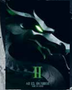
Mortal Kombat 2 ab / am 07.05.2026