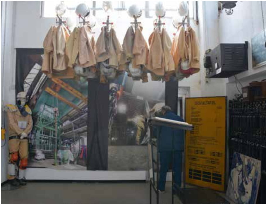
Kinder können im Rahmen einer Führung stilecht in den Stollen einfahren

tails, die berühren – und voller Hingabe von Menschen, die dieses Museum mit Leidenschaft am Leben halten. Moderne Medien, kurze Filme und anschauliche Installationen lassen die Vergangenheit lebendig werden. Man hört Stimmen, sieht Szenen, spürt die Atmosphäre. Und dann kommt der Moment, der wirklich unter die Haut geht: die Untertageanlage. Schon der Einstieg in den nachgebauten Förderkorb ist ein Erlebnis. Die Türen schließen sich, der Raum wird abgedunkelt, und plötzlich scheint man tatsächlich hunderte Meter in die Tiefe zu fahren. Die Rundumprojektion