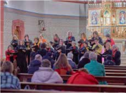
Der saarländische Frauenchor am 1. März 2026 in der St. Andreas-Kirche, Homburg-Erbach

am Sonntag, dem 15. März. Da singt der Chor nämlich um 17 Uhr sein Programm erneut im Kuppelsaal Wemmetsweiler in 66589 Merchweiler. Weitere Informationen unter www.saarlaendischer-frauenchor.de Zeitgleich an diesem Sonntag, dem 1. März, gastierte im nahe gelegenen Thomas Morus-Haus, quasi wirklich nur einen