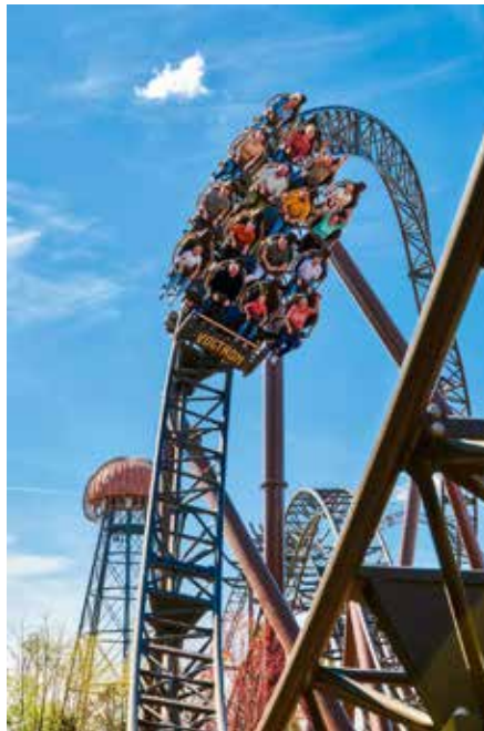
Mitten durch den Kroatischen Themenbereich schlängelt sich seit 2024 der 1.385 Meter lange Multi Launch Coaster Voltron Nevera powered by Rimac

Vulkanlandschaft des neuen Outdoor-Pool „Svømmepøl“ eintauchen. Im exklusiven Sauna- und Wohlfühlbereich bleiben mit drei Saunen und einem Dampfbad für Erholungssuchende keine Wünsche offen.