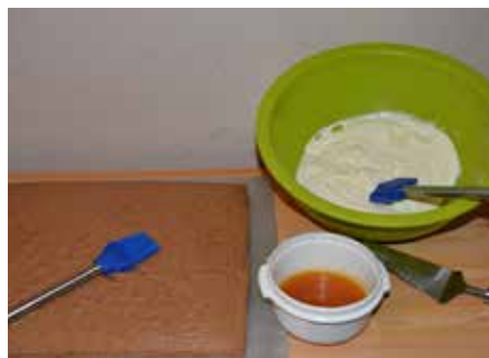
Bevor ihr die Creme auf den Boden streicht, kommt Aprikosenmarmelade darauf

Teig streicht ihr auf ein Backblech, das ihr vorher mit Butter und Backpapier auslegt. Nun kommt das Ganze für 12 Minuten in den Ofen. Solange der Kuchen abkühlt, kümmern wir uns um die Creme. Gebt dazu Mascarpone, Joghurt, Frischkäse und den Zucker in eine Schüssel und verrührt alles gut. Stellt es zur Seite. Die Aprikosen-