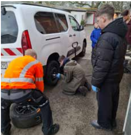
So lernen die Schüler*innen Reifenwechseln

erhielten die Jugendlichen zahlreiche Informationen über die Struktur des Unternehmens und die verschiedenen Berufsmöglichkeiten innerhalb eines großen Industriebetriebs. Auch die Firma Hager