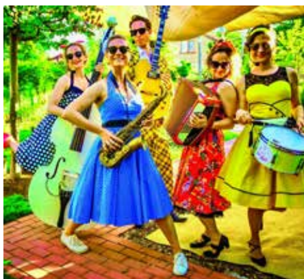
Am 23.8. wird „Evas Apfel“ die Zuhörerinnen und Zuhörer mit Jazz, Pop und unterhaltsamen Showeinlagen verführen

beim Jazzfrühschoppen, ein genüssliches Open Air Erlebnis bei freiem Eintritt und vielfältiger Außengastronomie ist in jeder