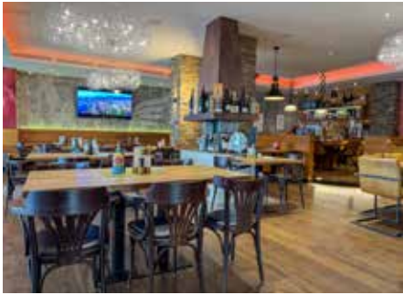
Einfach ein himmlisches Ambiente.

len, Kalkulationen und Rezepte kümmern – bis der damalige Küchenchef krankheitsbedingt ausfiel. Francesco, der zu Hause schon früh kochen gelernt hatte, sprang kurzerhand ein – und ist heute leidenschaftlicher Küchenchef eines zwanzigköpfigen Teams. Er organisiert, koordiniert, probiert