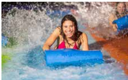
In Vikingløp, der größten Speed-Rutsche Europas, geht es mit dem Kopf voraus auf Matten dem Ziel entgegen

Outdoor-Abenteuer im Sommerparadies Im umfassenden Außenbereich wartet von Anfang Mai bis Ende September außergewöhnlicher Badespaß auf die Besucher. Ganz neu ist dort der großzügige „Svømmepøl“. Das mystisch nordisch gestaltete Outdoor-Becken ist ideal zum Schwimmen oder für genussvolles Ver-