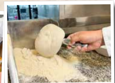
10. Rundum in Mehl baden

werden die vorportionierten Teigrohlinge etwa 2 bis 3 Stunden vor der Weiterverarbeitung aus dem Gärschrank genommen damit sie Zimmertemperatur annehmen und sich besser formen lassen. Um eine Pizza zu formen wird der Teigrohling nun vollständig mit