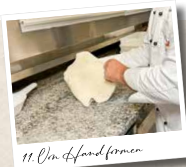
11. Von Hand formen

Mehl bedeckt ohne jedoch zusätzliches Mehl auf der Arbeitsplatte zu verteilen. So bleibt später kein Mehl am Teig kleben, welches im Ofen verbrennen würde. Das Formen der Pizza erfolgt natürlich per Hand.