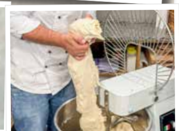
6. Nach 10 Min. Teig entnehmen