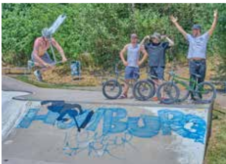
Die jungen Leute vom Jugend Kulturzentrum Homburg (JUKUZ) hatten einen Infostand am Skatepark im Stadtpark und zeigten dort ihr Können

Wie bereits in den vergangenen Jahren präsentierten sich an diesem Tag viele umliegende Vereine (dieses Mal rund 80 an der Zahl), warben für sich und ihre Aktivitäten und boten den vielen Kindern ein buntes Mitmach-Programm mit Spiel und Spaß an. Die Maus aus der „Sendung mit der Maus“ war als besonderer Gast-Star im Stadtpark, als sogenannter „Walk-Act“