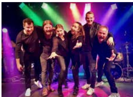
Am 1. August bietet die Formation „From Da Soul“ eine krachende Symbiose aus Soul, Pop und Funk © Band

Ob freitags ab 19:00 Uhr bei „Querbeat“ mit Musik aus allen Genres moderner Popmusik, oder samstags ab 11:00 Uhr