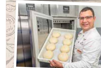
8. Min. 24h Gärschrank

werden die vorportionierten Teigrohlinge etwa 2 bis 3 Stunden vor der Weiterverarbeitung aus dem Gärschrank genommen damit sie Zimmertemperatur annehmen und sich besser formen lassen. Um eine Pizza zu formen wird der Teigrohling nun vollständig mit