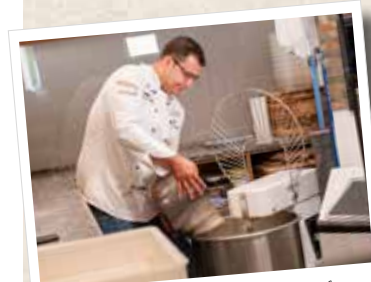
3. Mehl & Salz dazugeben