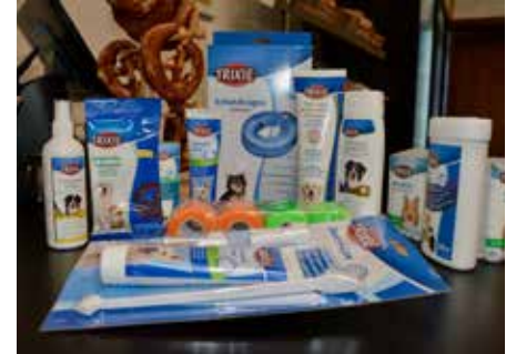
Viele Artikel für die Gesundheit Ihres Hundes oder Ihrer Katze runden das Angebot ab © se

len Preisen (in Kooperation mit Trixie Tierbedarf). Gratis-Futtertonne beim Kauf von Bosch-Futter (ab 10 kg). Begrüßungssnack für jeden Hund. Ein Unternehmen mit Haltung „Ich wollte von Anfang an zeigen, dass Tierbedarf auch anders geht – regional und ehrlich“, sagt die Gründerin. Mit ihrer Eigenmarke Futternest bietet sie Naturkau-