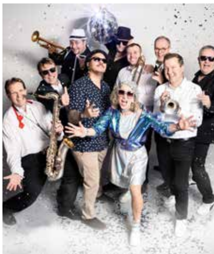
Weiter geht es am 22.8. mit „Disco Inferno“ und dem „Sound of 70s Funk & Disco“

Band Sounds: Swing- und Jazz-Arrangements, Latin und Filmmusik bis hin zu Funk, Soul und Rockn & Roll. Am 8. August kommen dann die Freunde des Blues auf ihre Kosten. Diese Musikrichtung wird in Deutschland von keiner anderen Band so erfolgreich repräsentiert wie von Todor Todorovic und seiner Blues Company.