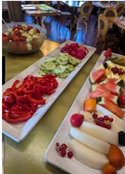
Frisches Obst und Gemüse gehört ebenfalls zum Frühstücksbuffet dazu

aufmerksam, aber niemals aufdringlich und gerne kommt jemand am Tisch vorbei und fragt höflich, ob denn auch alles in Ordnung sei. Die Auswahl fällt schwer, denn die Käseplatte mit drei Sorten Käse sieht