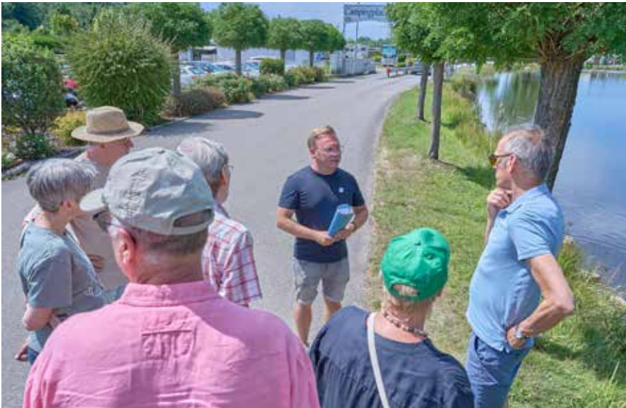
Diskussionspunkt hier: Invasive südamerikanische Krebsart eindämmen

Lichtverschmutzung zu reduzieren. Auch in Sachen Energieeffizienz wurde viel erreicht. Der Stromverbrauch sank durch eigene Photovoltaikanlagen deutlich, es