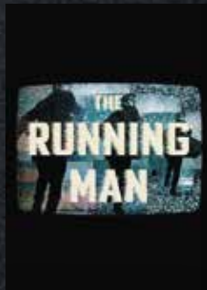
The Running Man ab / am 06.11.2025