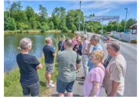
Zukunftsansiedlungsprojekt „Sumpfschildkröte“

wurde auf Ökostrom umgestellt und der Dieserverbrauch konnte seit 2016 um rund 75 Prozent gesenkt werden. Ein vom Platzwart vorgestellter Elektrobagger zeigt, wie der Wechsel funktionieren kann, mit Vorteilen für Mitarbeitende durch weniger Lärm- und Luftverschmutzung. Ziel ist langfristig ein klimaneutraler oder sogar klimapositiver Betrieb. „Diese Initiative zeigt, dass Tourismus und Ökologie sehr gut zusammenpassen“, sagte Katrin Lauer, Spre-