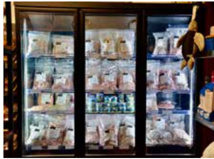
Barf-Produkte von Barfgold erhalten Sie im Lagerverkauf

Pflegeartikeln und Pferdefutter. Immer am Puls der Zeit Neben bewährten Klassikern hält Tierbedarf Schwarz stets die neuesten Trends bereit – Vom hochwertigen Katzenfutter über innovatives Zubehör bis hin zu Spezialprodukten für wählerische Katzen finden Tierliebhaber hier alles, was das