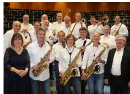
Am 6. September spielt die Uni-Bigband auf

Am Samstag 9. August ist mit Unavantaluna ein Top-Ensemble mit Musikern der fünf sizilianischen Provinzen beim Musiksommer zu hören. Eine gefragte Band auf Folk-Festivals in ganz Europa, mit Jazz in seiner Ursprungsform. Die Reihe Querbeat legt dann am 15. August eine Pause ein wegen der zeitgleich stattfindenden Probe