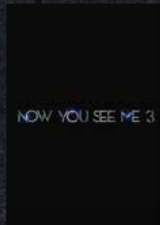
Die Unfassbaren 3 - Now you see me ab/am 13.11.2025