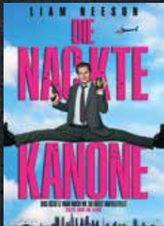
Die nackte Kanone ab / am 31.07.2025