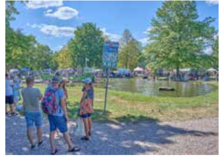
Der Floßteich war im Grunde der einzig „kühle Ort“ auf dem diesjährigen 25. Homburger Familien- und Kinderfest

Michelin Reifenwerke sowie die Medienpartner SR1 und Homburg1. Es war an diesem herrlich bunten Sonntag im Stadtpark unheimlich heiß, mit Temperaturen von weit über 30°Celsius! Das tat jedoch dem