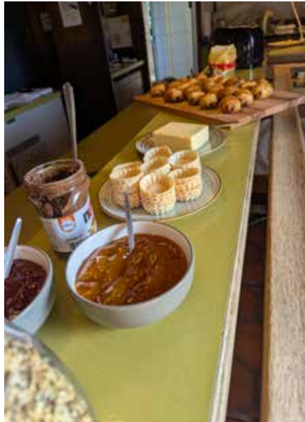
Für die süßen Frühstückser gibt es eine Auswahl an leckeren Brotaufstrichen