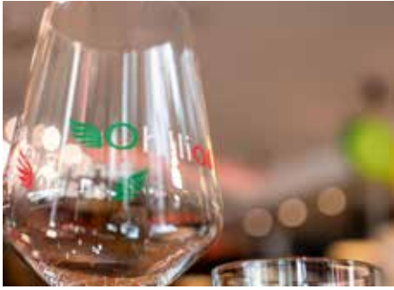
Das italienische Lebensgefühl findet sich mit vielen kleinen, liebevollen Details im Restaurant wieder.