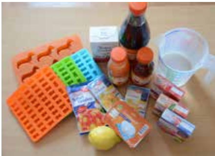
Zur Gummibärchen-Produktion stehen in der Küche die Zutaten bereit