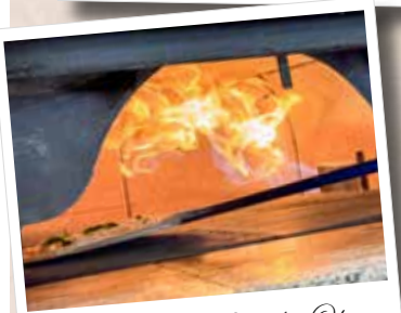
15. Bei 300 - 350 °C in den Ofen