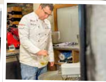
5. Olivenöl dazugeben