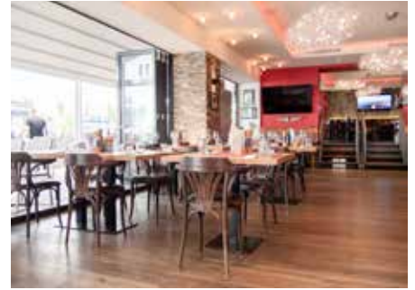
Der großzügige Gastraum bietet Platz für viele Gäste, ohne dabei ungemütlich zu wirken.

mit professionellen Geräten, einem Menüsystem aus der Schweiz und einem original italienischen Steinofen, wie er in Neapel stehen könnte. Innerhalb von einem Dreivierteljahr wurde das Gebäude in ein mo-