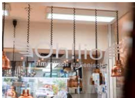
Der Name schwebt auf der Glaswand, welche den Gästen des Restaurants die Gelegenheit gibt Einblicke in die italienische Kochkunst zu erlangen.