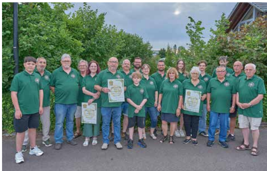
Einige Mitglieder des Schützenclubs Erbach e.V. 1955 bei der 70-Jahr-Feier