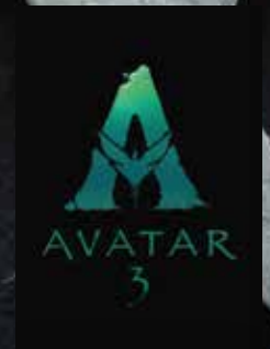
Avatar: Fire and Ash ab / am 17.12.2025