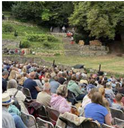
Inmitten einer idyllischen Kulisse erlebten die kleinen Gäste und ihre Familien eine zauberhafte Aufführung des Klassikers Rumpelstilzchen

Kunden und ihre Familien bei einem solchen Event zu sehen. Der Familientag auf der Naturbühne Gräfinthal ist ein fester Bestandteil unseres Jahresprogramms und wir