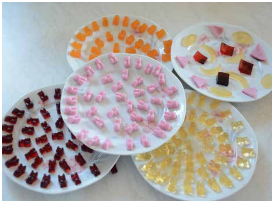
Leckere Gummibärchen-Rezepte haben wir für euch ausprobiert © se

Mehr als ein Monatsmagazin Informativ, lehrreich, unterhaltsam