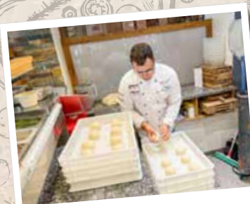
7. Portionieren & Bälle formen

Im Anschluss kann der Teig aus der Schüssel genommen und in gleichgroße Portionen unterteilt werden und in Bälle geformt werden. Je runder der Teigball, desto runder wird später die Pizza. Die einzelnen Rohlinge setzt man nun behutsam in eine Teigbox, wo sie abgedeckt so lange bei Zimmertemperatur stehen, bis sich ihr Volumen etwa verdoppelt hat. Für eine traditionell italienische Pizza, wie man sie im Oh!lio bekommt, sollte jedes Teigbällchen ca. 320g wiegen.