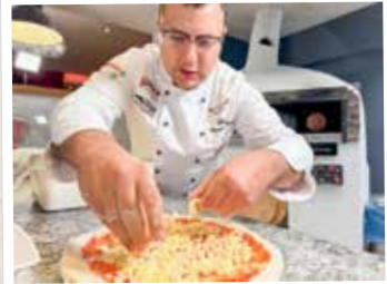
14. Nach Wunsch belegen

Nun kann die Tomatensauce drauf. Nicht zu viel, nicht zu wenig. Wie schon erwähnt werden für die Tomatensauce ausschließlich Mutti-Tomaten verwendet. Eine Prise Salz und etwas Pfeffer - das war's.