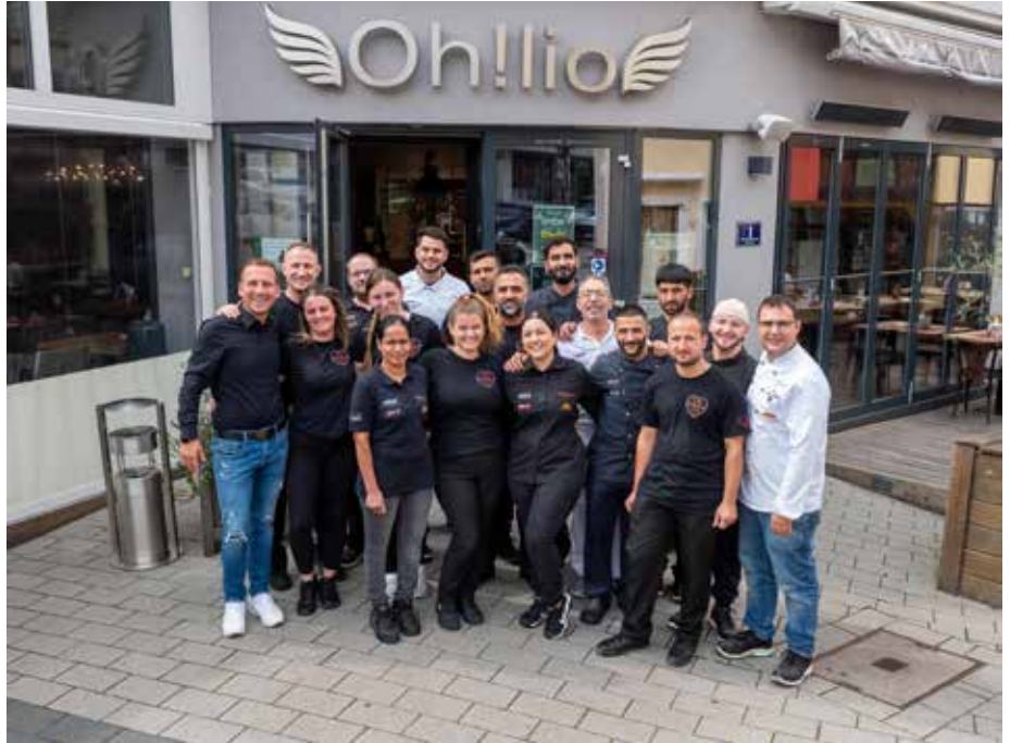
Das eingespielte Team des Oh!lio erwartet Sie um Ihnen mit Leidenschaft das italienische Lebensgefühl näher zu bringen.

ständig neue Gerichte aus und sagt selbst: „Die Gäste dürfen gerne in meinen Kochbüchern blättern – es geht nicht darum, Rezepte nachzukochen, sondern selbst kreativ zu werden.“ Seine Begeisterung ist spürbar, seine Küche ist präzise, aber nie steif. Und er liebt gutes Essen – „außer Nierchen und Kutteln“, wie er lachend zugeht. Gastronomischer Leiter des Hauses ist