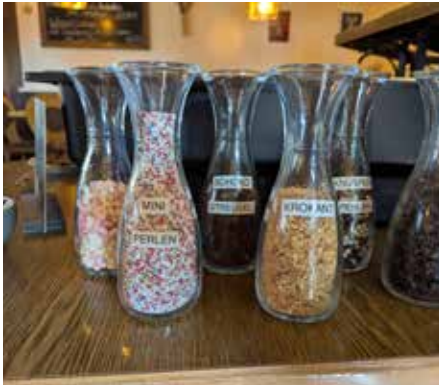
Leckeres Topping für Pancakes & Co

Abend eine Saarländische Tapas-Karte, eine großartige Idee, um vieles probieren zu können, am Tisch untereinander zu tau-