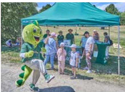
„Jolinchen“, das Maskottchen der AOK-Krankenkasse, tanzte fit wie ein Turnschuh auch bei Temperaturen über 30°C!!

regen Trubel keinen Abbruch. Ein jeder „kühlte“ sich eben so gut es ging. Sei es am Stand der Feuerwehr, zum Beispiel mit „Spritzen-Übungen“, oder auf dem Gelände des Homburger Wasserwerks, wo man mittels „Water Zorb“-Bällen übers