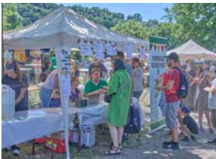
Am Stand der Homburger Narrenzunft gab es Kuchen, Waffeln, Popcorn, Pommes, Wurst und allerlei Getränke zu kaufen

Michelin Reifenwerke sowie die Medienpartner SR1 und Homburg1. Es war an diesem herrlich bunten Sonntag im Stadtpark unheimlich heiß, mit Temperaturen von weit über 30°Celsius! Das tat jedoch dem