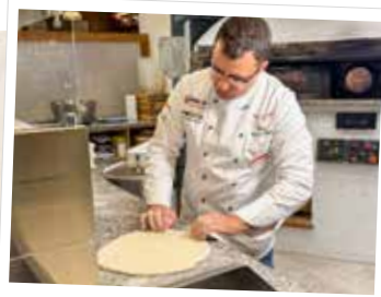
12. Schön rund muss sie sein

Mehl bedeckt ohne jedoch zusätzliches Mehl auf der Arbeitsplatte zu verteilen. So bleibt später kein Mehl am Teig kleben, welches im Ofen verbrennen würde. Das Formen der Pizza erfolgt natürlich per Hand.