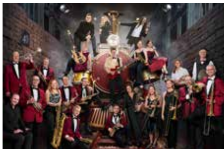
Am Samstag 2. August gibt wieder einmal „Mike's Music Train“ aus München ein Stelldichein auf dem Homburger Marktplatz

und Funk. Einen Tag später am Samstag 2. August gibt wieder einmal „Mike's Music Train“ aus München ein Stelldichein auf dem Homburger Marktplatz. MMT beherrscht alle Facetten des modernen Big-