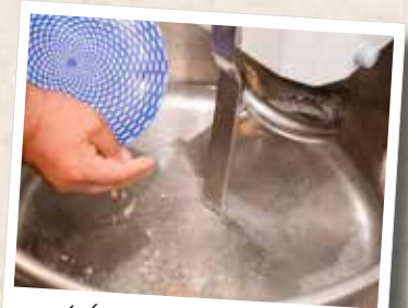
2. Hefe ins Wasser

Dann das Salz dazu und zunächst für etwa 8 Minuten in einer großen Schüssel vermengen, bevor das Olivenöl dazugegeben wird und der Teig weitere 12 Minuten kräftig geknetet werden kann. Im Oh!lio übernimmt das Kneten eine italienische Maschine, zuhause empfiehlt es sich eine Küchenmaschine mit Kneithaken zu verwenden, um sich die Arbeit ein wenig zu erleichtern. Nach dem Kneten lässt man den Teig zunächst für weitere 10 Minuten ruhen, damit er sich entspannen und die Hefe zu arbeiten beginnen kann.