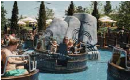
Das gibt's nur in Rulantica: Im Tønnevirvel heißt es „Ab in die Boote... fertig... nass“!

Vibes“ ein entspannter Sommerabend vor der spektakulären Kulisse der Outdoor-Rutschenwelt „Svalgurok“ verbringen: ideal für all diejenigen, die sich nach einem sommerlich-gechillten Abend mit entspannenden Sounds und coolen Drinks sehnen. Den entspannten Übergang vom Sommer zum Herbst bildet die Skandinavische Saunawoche vom 19. bis 28. September. Wasserspaß zu jeder Jahreszeit Auch im Indoor-Bereich der Wasserwelt ist Action angesagt. Bei „Dugdrob“ und „Vildfål“ geht es im freien Fall durch Rangnakor. Dabei ist der Adrenalinkick garantiert. Für weiteren Wasserspaß sorgt „Vikingsløp“, die größte Speed-Rutsche Europas. In acht Röhren auf insgesamt mehr als 1.500 Metern Länge rutschen die Gäste dabei auf Matten liegend um die Wette. Gäste, die ihre Zeit eher gemütlich verbringen möchten, können sich in „Snorri's Saga“ auf einem 250 Meter langen Lazy River auf Reifen