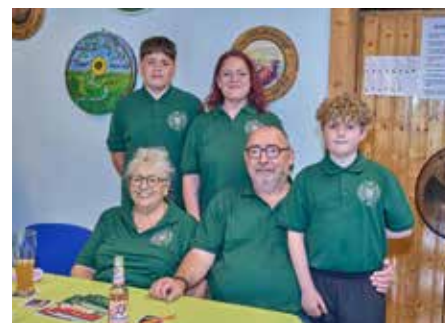
Familie Thomas ist schon lange im Verein tätig

len Gesprächen, Erinnerungen und guten Begegnungen aus. Ein herzlicher Dank gilt auch allen Inserenten und Spendern, die mit ihrer großzügigen Unterstützung die Erstellung der Festschrift ermöglicht und damit wesentlich zum Gelingen des Jubiläums beigetragen haben. Ihr Engagement ist ein wichtiges Zeichen der Verbundenheit mit dem Verein. Der Schützen-Club Erbach blickt stolz auf 70 Jahre Vereinsgeschichte zurück, die geprägt ist von Zusammenhalt, sportlicher Begeisterung und ehrenamtlichem Engagement und freut sich mit seinen Mitgliedern auf viele weitere erfolgreiche Jahre im Dienst der Gemeinschaft.