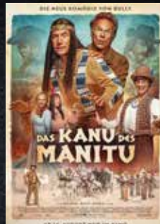
Das Kanu des Manitu ab/am 14.08.2025