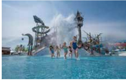
Ob spannende Rutschpartien auf den zehn unterschiedlichen Rutschen, eine Abkühlung unter dem riesigen Wassereimer oder unendlicher Spaß mit den über 100 verschiedenen Spielmöglichkeiten

vorbei an schroffen Felsen, mächtigen Kiefern und einem imposanten Schiffswrack treiben lassen. Auch für die Jüngsten wird im Innenbereich der Wasserwelt einiges geboten: Im idyllischen „Trølldal“ können sie in sicherer Umgebung zwischen Trollen im Wasser spielen und erste Rutscherfahrten sammeln. Bei der Attraktion „Snorri Snorkling VR“ von MackNeXT und VR Coaster können Fans des süßen Rulantica Charakters mit Taucherbrille und Schnorchel in eine fantastische Unterwasserwelt eintauchen. Wohlfühl-„Hyggedal“ Erwachsene können es sich anschließend im exklusiven Sauna- und Wohlfühlbereich „Hyggedal“ gemütlich machen. Die Entspannungsoase in nordischem Ambiente befindet sich oberhalb des Restaurants „Lumålunda“ und bietet einen traumhaften Blick über die gesamte Wasserwelt. Auf über 1.000 m² warten auf die Gäste unter anderem gemütliche Liegemöglichkeiten und für Besucher ab 18 Jahren drei textiltreie Holzsaunen mit einer großen Außenterrasse sowie ein Dampfbad. „Hyggedal“ verfügt als besonderes Highlight außerdem über die „Hygge Supreme Hydda“ – eine