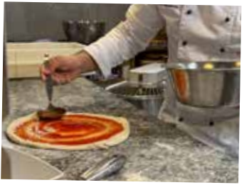
13. Tomatensauce drauf

Nun zeigt sich, ob die Bälle schön rund geformt wurden, denn nur dann wird es die Pizza später ebenso. Im Oh!lio ist der Boden etwas dicker.