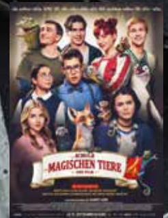
Die Schule der magischen Tiere 4 ab / am 25.09.2025