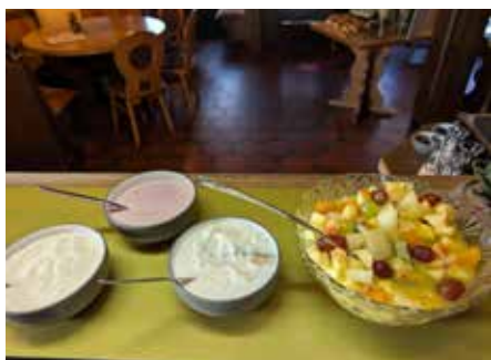
Obstsalat und Joghurt dürfen nicht fehlen

Ein leckeres Frühstück kann der Beginn eines wundervollen Tages sein und dies bekommen Sie in Furpach für nur 13,90 € pro Person. Es duftet nach frischen Brötchen, Croissants und Pancakes beim Eintreten in den gemütlichen Gasträum des Restaurants „Zum Landsknecht in Furpach“ und sogleich wird man auch sehr freundlich begrüßt von Verena und Turgut Tünay und ihrem zuvorkommenden Team. Von Donnerstag bis Sonntag jeweils von 9.00 Uhr bis 11.00 Uhr können Sie sich an den Köstlichkeiten vom Frühstücksbuffet laben und es bleiben wirklich keine Wünsche offen. Für ein großartiges Preis- Leistungsverhältnis stehen Ihnen alle Möglichkeiten für ein