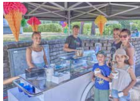
Viel trinken und ab und zu ein Eis - das war die Devise des Tages - hier am Stand der Gelat!Oh-Eismanufaktur