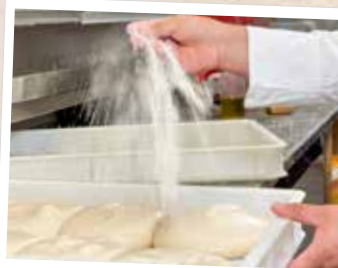
9. Teig mit Mehl bestäuben