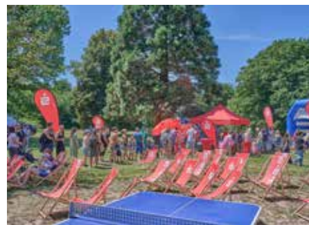
Im „Sparkassen-Areal“ standen die Menschen am Stand der Kreissparkasse Schlange!

Sponsoren haben mit ihrer Unterstützung das 25. Familien- und Kinderfest erst möglich gemacht. Hierzu gehörten: Stadtwerke Homburg, Kreissparkasse Saarpfalz, LBS, Saarland-Versicherungen, Bank 1 Saar,