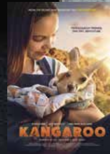
Lilly und die Kängurus ab / am 28.08.2025