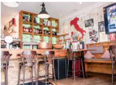
Der Barbereich des Oh!lio ist besonders gemütlich gestaltet. Auch hier kann man, wenn man möchte, einen Blick in die Kochbücher werfen.