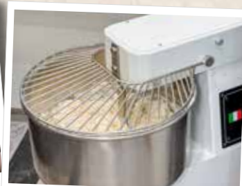
4. 8 Minuten kneten lassen