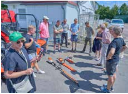
Die akkubetriebenen Werkzeuge werden vorwiegend mit Solarstrom aufgeladen

und konkret zum Schutz der Natur bei.“ Gemeinsam äußerten sich die Grünen und Steven Enkler kritisch zur geplanten Ausweitung der Grundwasserentnahme durch den Wasserzweckverband Ost (WVO). Es geht hierbei darum, die Fördermenge des