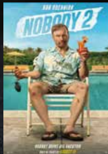
Nobody 2 ab / am 14.08.2025