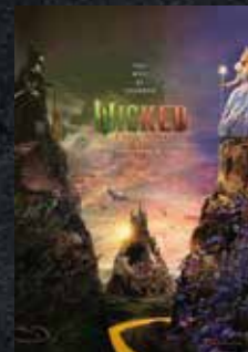
Wicked: Teil 2 ab/am 20.11.2025