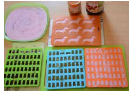
Alles ist in den Förmchen, nun geht es ab in den Kühlschrank zum Festwerden

mit dem Wasser oder dem Fruchtsaft ein. Nach der Wartezeit stellt Ihr den Topf auf den Herd und schaltet ihn auf eine kleine Stufe ein, das reicht aus zum Erwärmen. Nun bringt ihr nach Packungsangabe die Flüssigkeit zum Kochen, bis sich die Götterspeise (Gelatine oder Agar-Agar) aufgelöst hat. Bei den Fruchtsaftgummibärchen macht ihr Zitronensaft und Zucker dazu, bei denen mit Götterspeise den Zucker und die mit Quark erhalten den Quark und Zucker dazu. Gut durchrühren. Die Förmchen stellt ihr bereit. Die heiße Flüssigkeit füllt ihr in einen Messbecher, so könnt ihr sie besser verteilen. Wenn ihr keine Förmchen habt, könnt ihr die Flüssigkeit auch in eine flache Form schütten. Nun muss alles fest werden, das geht relativ schnell im Kühlschrank. Mit Ausstechförmchen könnt ihr aus der Platte eure Gummi-Süßigkeiten