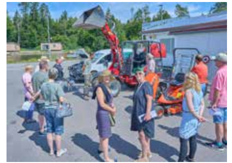
Vorstellung des ökonomischeren Fuhrparks des Campingplatzes Königsbruch

cherin der Grünen Homburg. „Eine derartige Führungsweise eines Unternehmens unter Einbezug von Möglichkeiten zur Verbesserung der Biodiversität trägt lokal