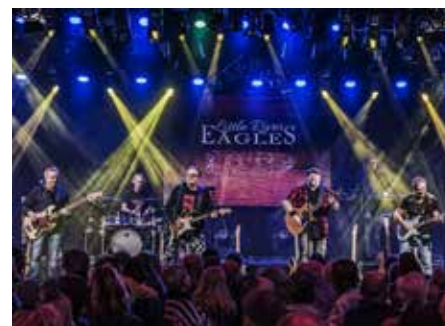
Am 5. September können Sie „Little River EAGLES“ erleben

zum Klassik Open Air auf dem Christian-Weber-Platz. Am Samstag 16. August findet vormittags wie gewohnt der Jazzfrühschoppen statt. Unter dem Motto „Feel The Spirit“ startet die Barrelhouse Jazzband in neuer Top-Besetzung in die Saison 2025, unter anderem mit Jan Luley am Piano, nachdem die langjährigen Frontmänner