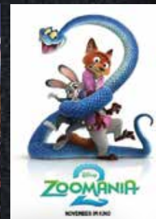
Zoomania 2 ab / am 27.11.2025