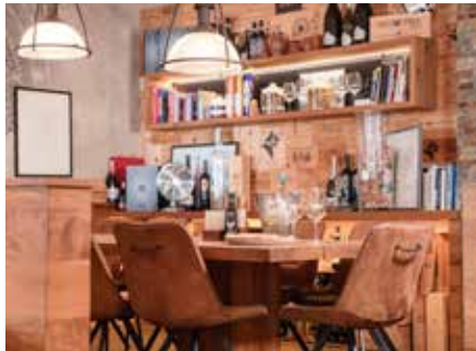
Unser persönliches Highlight ist die gemütliche Sitzcke im hinteren Teil des Restaurants, welche ein bisschen an ein Esszimmer zuhause erinnert.

wurde – das historische Eckhaus, der ehemalige Bertelsmann-Shop sowie das Nachbargebäude, ehemals ein Schmuckgeschäft – und aus einer Vision wurde ein ernsthaftes Projekt. Im Jahr 2014 begannen die Umbauten. Es wurde entkernt, durchgebrochen, erweitert, verbunden. Die Küche wurde komplett neu aufgebaut,