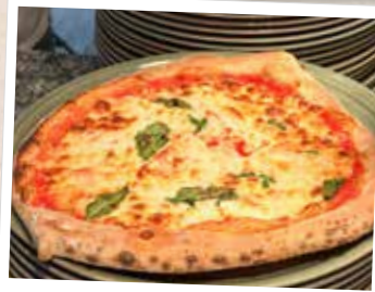
16. Pizza genießen!

Anschließend kann die Pizza bei 300 bis 350 Grad gebacken werden. Der Ofen sollte möglichst heiß sein und die Verweildauer der Pizza darin gerade nur so lange, bis sie eine schöne Bräune erhält.