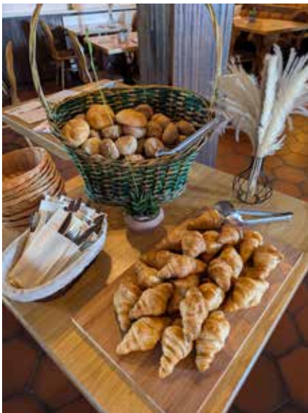
Frisch gebacken kommen die Croissants und Brötchen auf den Tisch

schen und das Beste ist, dass Turgut Tünay als erfahrener Koch alles wunderbar kombiniert. Und wer keine Tapas probieren möchte, der kann zwischen verschiedenen Gerichten oder Salaten wählen. Auf