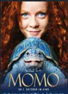
Momo ab / am 25.09.2025