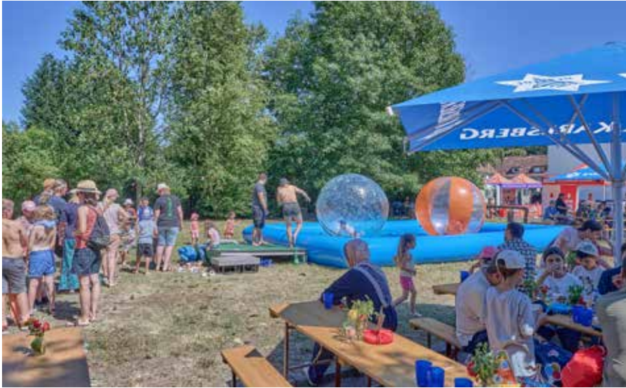
Auf dem Gelände des Homburger Wasserwerks