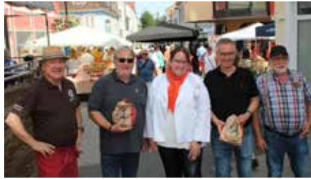
Bürgermeister Manfred Rippel bei der Eröffnung des Brotmarktes

alle, die örtlichen Bäckereien nach Kräften zu unterstützen“, betonte Manfred Rippel. Er wies auch auf die große Vielfalt und die Qualität der Brote hin, die etwas Besonderes darstellten. Auch Landrat Frank John ging auch die Bedeutung der Bäcker