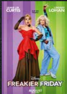
Freakier Friday ab/am 07.08.2025