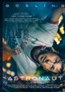
Der Astronaut - Project Hail Mary ab / am 19.03.2026