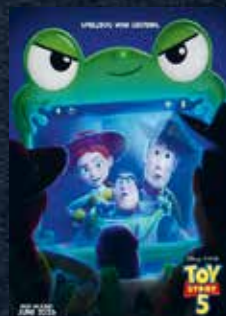
Toy Story 5 ab / am 18.06.2026