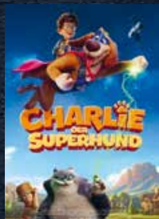
Charlie - Der Superhund ab / am 29.01.2026