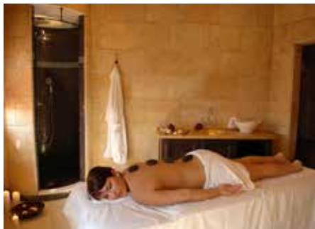
Entspannung pur mit Hotstone

Bei Buchung von zwei Nächten im Hotel „Colosseo“, „Krønasår“ oder „Bell Rock“ und zwei Tagen Eintritt in die Wasserwelt Rulantica erhält man das „2 für 1 Angebot“ zum Preis von einer Nacht mit einem Tag Eintritt in Rulantica. Für die Gäste ab 60 gibt es noch ein ganz besonders An-