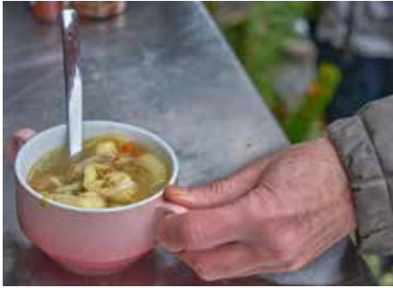
„Lecker, warm und kommt von Herzen“