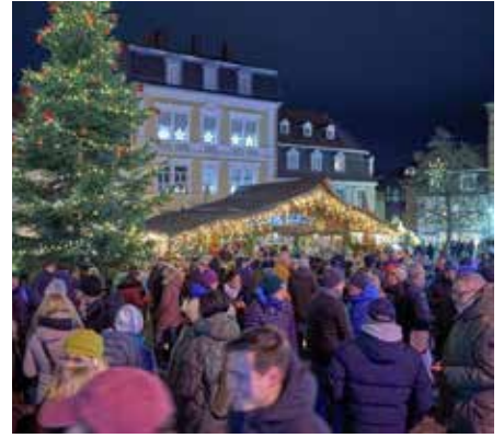
Der Homburger Marktplatz am 23.12.2025 mit Blick auf die Glühweinhütte