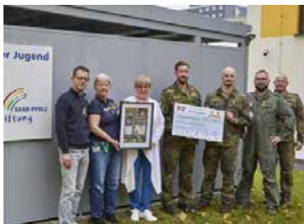
Die Bundeswehr war zu Besuch und hatte einen Spendenscheck über 13.500 Euro für die Elterninitiative krebskranker Kinder im Saarland e.V. im Gepäck