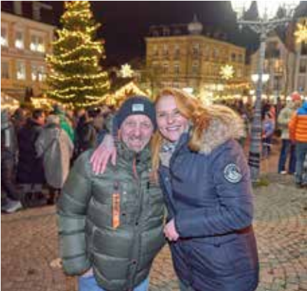
Fröhliche Gesichter und gut gelaunte Menschen bei der „Wir warten aufs Christkind-Party“ 2025

blieb der Eintritt auch in diesem Jahr frei. Ein friedliches Miteinander, Lachen, Tanzen und Anstoßen – besser kann man das Veranstaltungsjahr nicht ausklingen lassen,