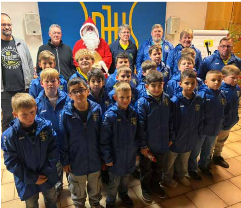
Gruppenfoto aller Spielerinnen und Spieler mit Trainern, Betreuern und den Mitgliedern des Fördervereins

Zwei Tage voller Gemeinschaft und Weihnachtsfreude Am Freitagabend standen die C- und D-Junioren der SG Bexbach im Mittelpunkt. Rund 50 Spieler sowie etwa 80 Eltern und Fans genossen Grillgut vom großen Buchenholzgrill, leckeren Kuchen und wärmenden Weihnachtspunsch. Der Samstag gehörte den jüngeren Mannschaften: E-, F- und G-Junioren der DJK Bexbach. Hier lag auch der Schwer-