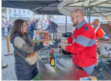
Mitarbeiter vom DRK Ortsverband Homburg halfen bei der Essensausgabe mit

Material für Einsätze sicherzustellen. Von den Spenden profitieren unter anderem die Rettungshundestaffel und Bereiche des Katastrophenschutzes.) Bedanken möchte sich Marco Dante auch noch ganz herzlich bei dem Oh!io/Vin!Oh-Team, den