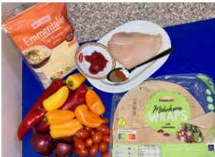
Diese Zutaten benötigt ihr für unsere Pizzataschen