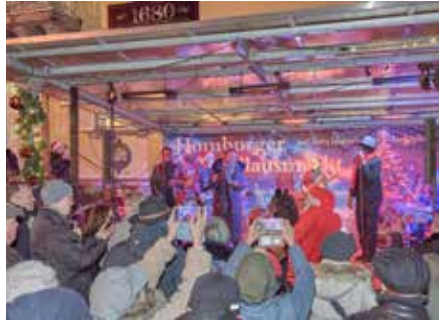
Die Elmar Federkeil-Kombo spielte bei der „Wir warten aufs Christkind-Party“ 2025