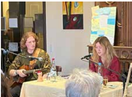
Die Lesung wurde auch musikalisch begleitet