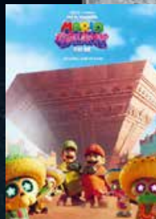
Der Super Mario Galaxy Film ab / am 02.04.2026