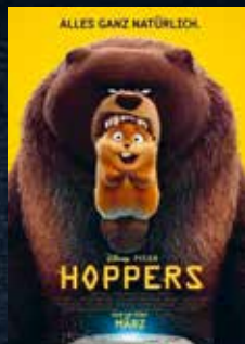
Hoppers ab / am 05.03.2026