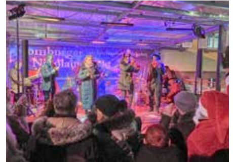
War der Weihnachtstmann etwa auch dort? (siehe rechts)