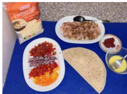
Alles ist bereit, es kann losgehen

Dann schneidet ihr die Wraps in Hälften. Verquirlt das Ei und stellt den Käse bereit. Vergesst das Tomatenmark nicht, das braucht ihr, um die Wraps zu verkleben. Streicht eure Wrap-Hälfte rundum mit dem Tomatenmark ein, dann gebt ein Häufchen