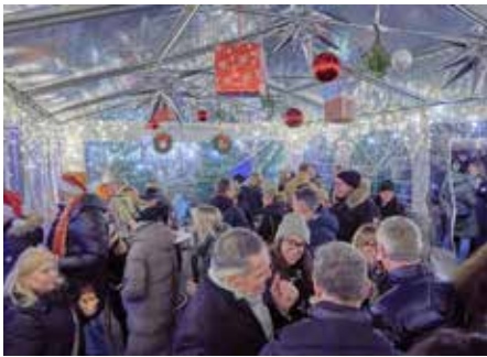
Szene im schön geschmückten Vorzelt des Vin!Oh

Doch einer ragt jedes Jahr heraus, weil er dieses ganz spezielle „Wir-Gefühl“ ausstrahlt: die „Wir warten aufs Christkind“-Party, immer am 23. Dezember, und das nun schon seit 2017. Wenn die letzte Hektik der Weihnachtseinkäufe in der Tal-