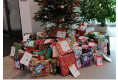
Die Geschenkeaktion war ein voller Erfolg

nachten über ein Päckchen freuen können, organisiert der Kinderschutzbund Landesverband Saarland diese besondere Initiati-