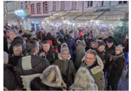
Auch vor dem Vin!Oh tummelten sich die Leute

der Gitarre und natürlich Elmar Federkeil, selbst an den Drums. Der Abend war ein echtes Geschenk an die Bürger der Stadt! Das Schönste daran? „Diese Party ist für viele von uns der eigentliche Auftakt in die Feiertage. Es ist dieses Gefühl von Gemeinschaft, das den Abend so einzigartig macht“, sagte jemand aus dem Publikum. Dank der Unterstützung der Dr. Theiss Naturwaren GmbH und der Organisation durch die Homburger Kulturgesellschaft