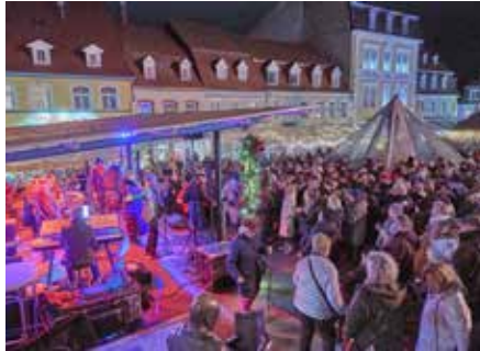
Die Party am 23.12. in Homburg war ein voller Erfolg mit einem enormen Zuspruch!

„Federkeil Music – Gospel Power Voices“ holte Elmar Federkeil internationale Weltklasse-Musik erneut direkt zu uns nach Homburg. Von 18 bis 22 Uhr verwandelten Stimmen wie die von Journi Sings, Simone