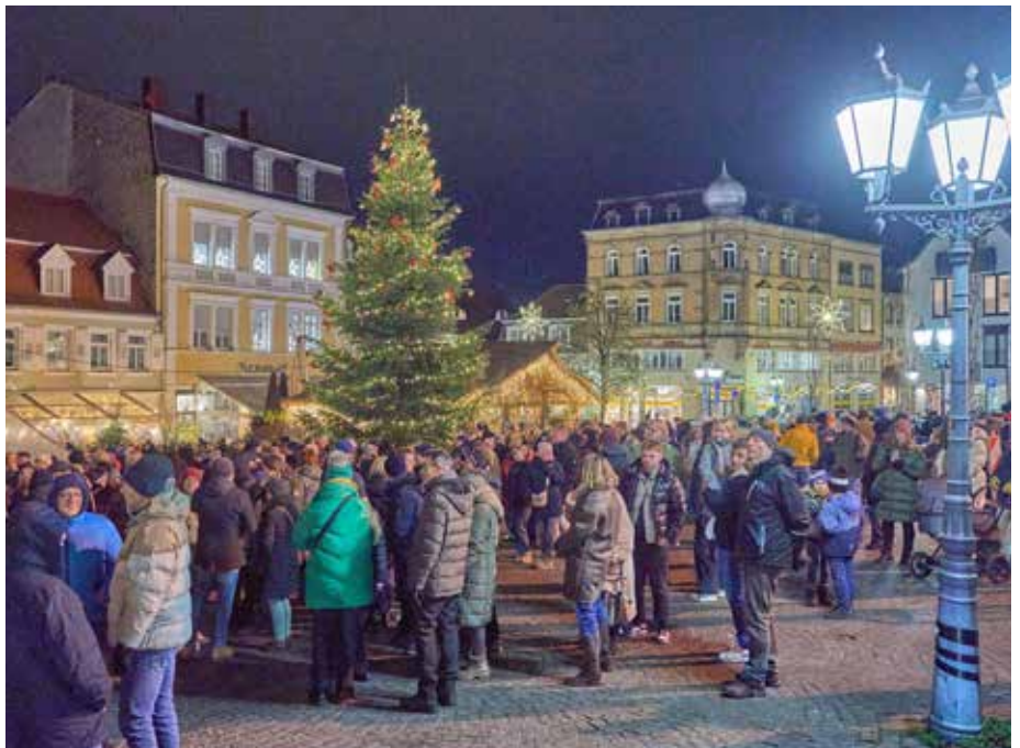
Unzählige Menschen auf dem Homburger Marktplatz am Abend des 23.12.2025