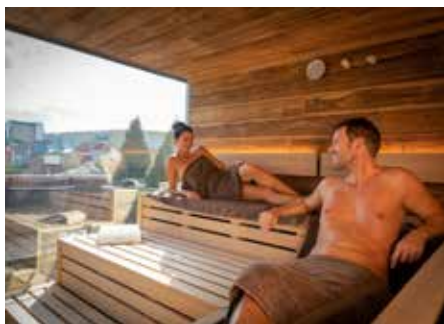
Genießen Sie den Wellness- und Saunabereich in Kronasar

gebot für einen wunderschönen Tag in der Wasserwelt inklusive Übernachtung. Auch Eltern mit ihren Kindern kommen ganz auf ihre Kosten: Bei „Kids for free“ können Familien nach einer traumhaften Übernachtung und einem vielfältigen Frühstück einen Tag in der Wasserwelt Rulantica verbringen. Bei Buchung erhalten bis zu drei Kinder (von 4-11 Jahren), die mit