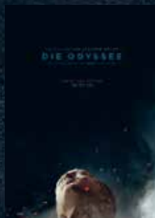
Die Odyssee ab / am 16.07.2026