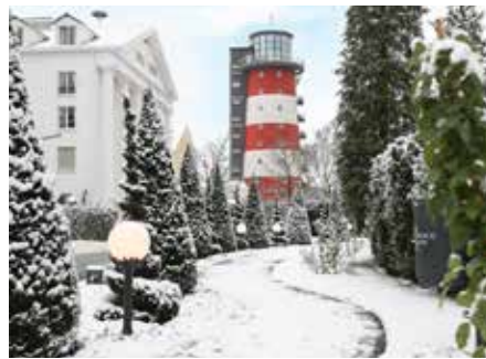
Ein Traum ist der Winter im Hotel Bell Rock

Das kulinarische Rundum-Vergnügen gibt es bei der Europa-Park Dinner-Show mit Übernachtung. Neben einem Abend voll atemberaubender Artistik, Show und einem kulinarischen Verwöhnprogramm nächtigen die Gäste wie auf Wolken in den Hotels „Colosseo“, „Bell Rock“ oder „Krønasår“. Gourmets kommen beim „Ammolite Genießer-Arrangement“ mit einem 6-Gänge-Feinschmecker-Menü im 2-Sterne-Restaurant „Ammolite – The Lighthouse Restaurant“ auf ihre Kosten und können mit allen Sinnen genießen. Anschließend schlummern sie selig in den Betten des 4-Sterne Superior Hotel „Bell