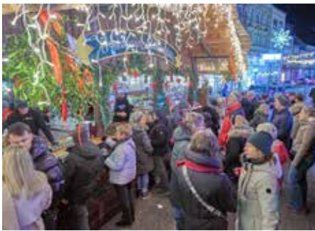
Vor der Glühweinhütte auf dem Homburger Marktplatz am 23.12.2025

straße verfliegen ist, und die Lichter auf dem historischen Marktplatz erstrahlen, dann verwandelt sich das Areal mit seinen umliegenden Gastronomiebetrieben in eine festliche Open-Air-Bühne. Der 23.12. ist der Abend der Heimkehrer, der Alteingesessenen und der Familien. Man trifft Freunde, die man eventuell ja das ganze Jahr über nicht gesehen hat, wärmt die Hände am Glühwein und spürt: Jetzt ist Weihnachten! Im vergangenen Dezember 2025 war die Gänsehaut-Garantie mit Gospel-Power unter freiem Himmel wieder einmal inklusive. Mit der Formation