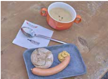
Die köstliche Kartoffelsuppe mit Wiener Würstchen daneben

Redaktion finden, und das in einer Zeit, die leider viel zu oft von Hektik und Konsum geprägt ist. So gesehen steht die Veranstaltung „Offene Suppenküche“ im doppelten Sinne für „Wärme, die von innen kommt“. Das Konzept war bisher immer genauso simpel wie wirkungsvoll. In diesem Jahr kamen 20.000 Euro an Spenden zusammen. Diese Summe geht restlos an das DRK für Ausbildung, Ausrüstung und den Einsatz der ehrenamtlichen Helfer. (Hintergrund ist die Insolvenz des Verbandes im vergangenen Jahr, durch die finanzielle Mittel fehlen, um Aufgaben wie Ausbildung und Ausrüstung der Helfer oder