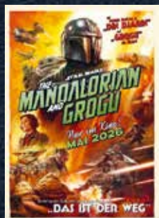
The Mandalorian und Grogu ab / am 20.05.2026