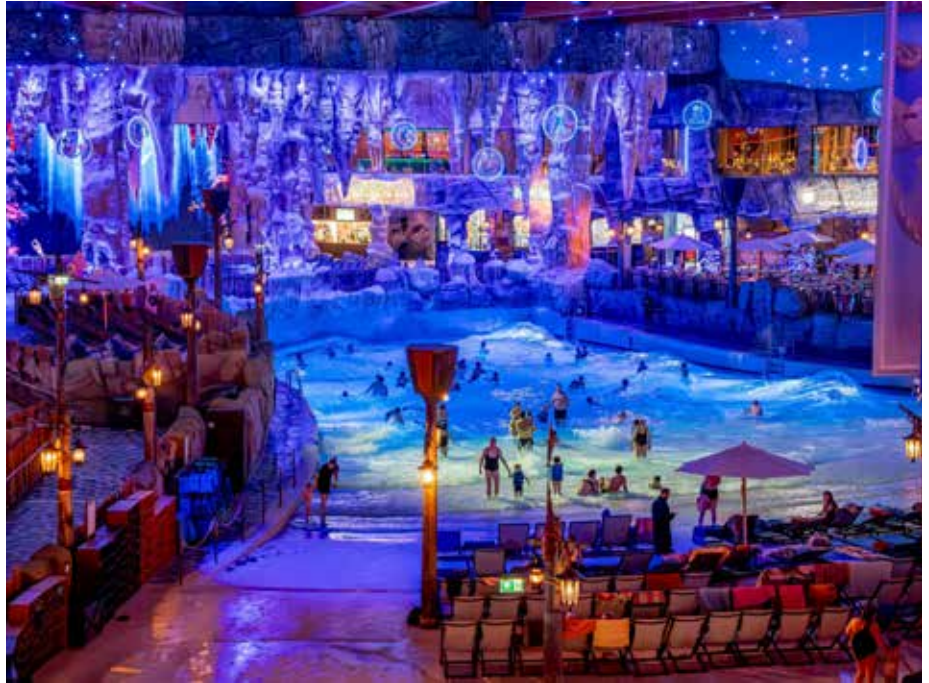
Genießen Sie die großartige Atmosphäre beim Nordischen Lichterfest

Auf insgesamt 1.000 m 2 erstreckt sich über dem Restaurant „Lumålunda“ eine nordische Wohlfühlloase mit traumhaftem Blick über die Wasserwelt. Drei Saunen mit herrlichen Aufgüssen, ein Dampfbad, Außenterrassen und bequeme Liegemöglichkeiten lassen keine Wünsche offen. Ein etwas anderes Sauna-Erlebnis bietet das „KOTA Sauna Chalet“: Hier können die Gäste inmitten von rustikalen Tischen und Sitzgelegenheiten sowie einem Saunaofen zünftig saunieren und dabei ein leckeres Weißbier genießen. Darüber hinaus bietet die „Hygge Sauna-Bar“ exklusiv für die Gäste des Sauna- und Wohlfühlbereichs Hyggedal ein frisches gastronomisches Angebot. Komfort-Highlight: Mit seinen exklusiven Tages-Suiten hat Ru-