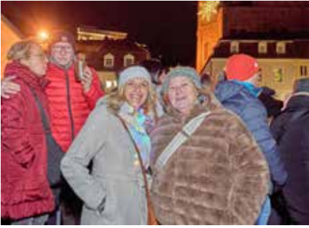
Die Menschen am Marktbrunnen vor der Bühne hatten viel Spaß am Abend des 23. Dezembers