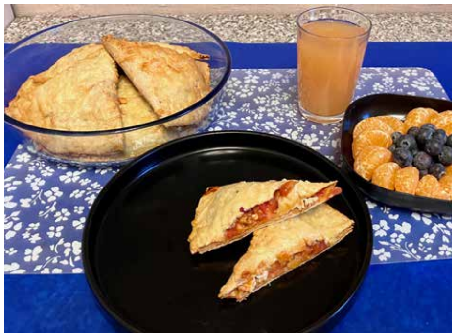
Leckere und einfach zubereitete Pizzataschen und ein vitaminreicher Nachtisch