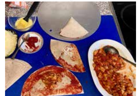
So faltet ihr die Taschen © se

von der Fleisch-Gemüsemasse in die Mitte und ein wenig Käse darauf. Klappt dann erst eine Hälfte des Wraps über das Häufchen und dann die andere Hälfte von der anderen Seite. Drückt die Ränder fest an. Dann streicht ihr die Tasche mit Ei ein und streut Käse darauf. Die so vorbereitete Tasche kommt auf ein Backblech oder in den