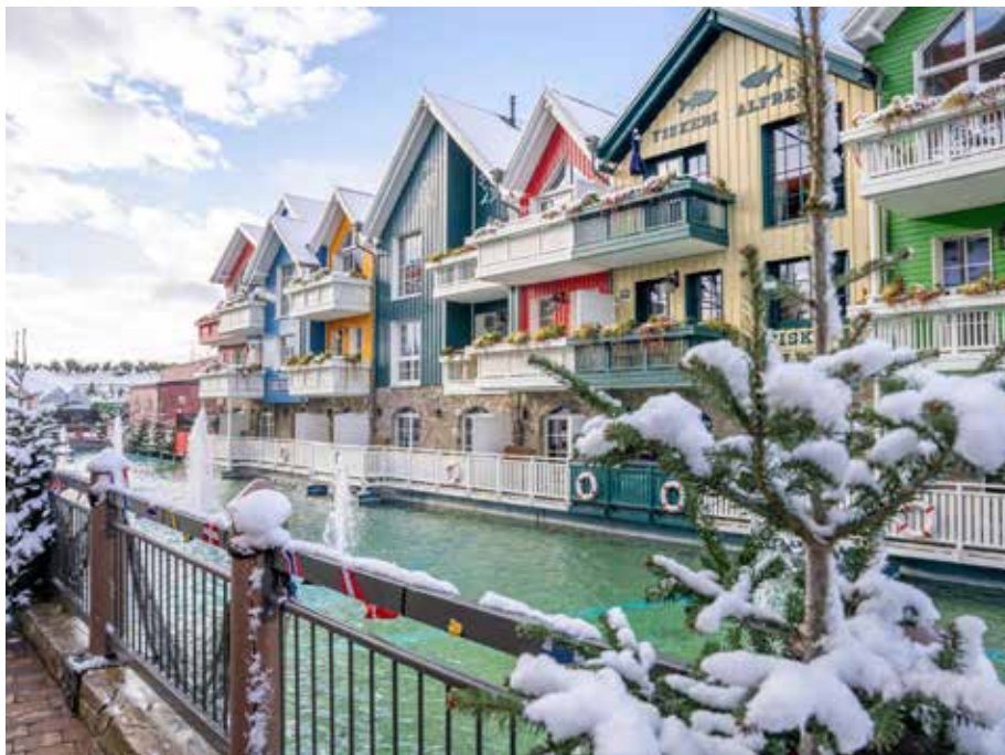
Die atemberaubende Kulisse vom Hotel Konasar lädt zum Verweilen ein

Auf 3.400 m 2 bieten die Europa-Park Hotels großzügige Wellness- und Spa-Bereiche mit liebevoll thematisierten Pool- und