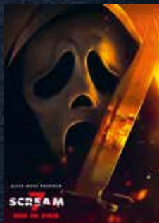
Scream 7 ab / am 26.02.2026