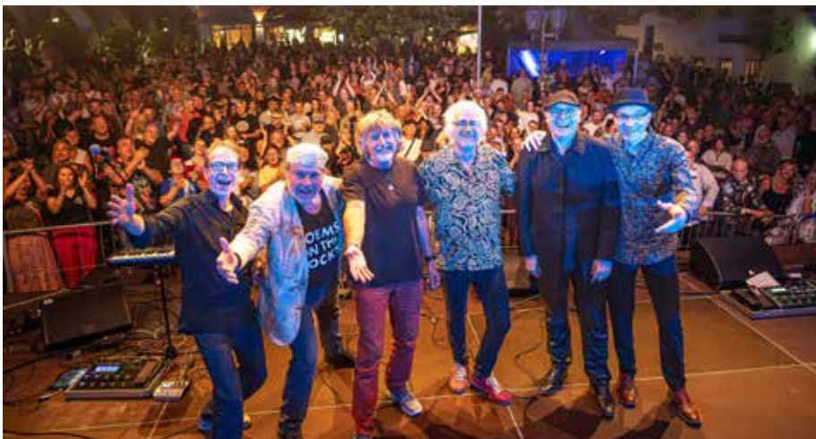
Freuen Sie sich auf einen fulminanten Abend mit POEMS ON THE ROCKS © Richard Dannemann

Karten für die Veranstaltung am Freitag, 06.03.2026 um 20 Uhr im Saalbau Homburg sind erhältlich über ticket regional, in der Tourist Info, sowie an der Abendkasse. Die Karten kosten 20,- € zzgl. VVK Gebühr. © Homburger Kulturgesellschaft