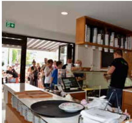
Am Eröffnungstag war jede Menge los am Marktplatz in Waldmohr

Platz nehmen und sich vom freundlichen, aufmerksamen Team verwöhnen lassen. Der Außenbereich bietet Platz für bis zu 80 Personen und im Inneren befinden sich ca. 60 Plätze. Übrigens ist das Gelat!oh in Homburg auch barrierefrei. In Homburg finden Sie außerdem leckere Kuchen und Tiramisu in der Kühltheke, lassen Sie sich gerne vom Angebot überraschen. Das Gelat!oh Homburg bietet aber auch noch etwas ganz Besonderes, denn hier können Sie sich Ihr Eis am Stiel selbst gestalten. Sie suchen Ihre Lieblingseissorte aus, wählen die passende Schokolade und gerne auch