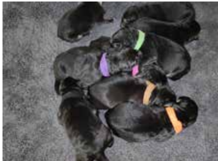
Winzig klein und schwarz waren die Welpen am Wurftag

besondere Pflege, regelmäßiges Bürsten sollte aber schon sein. Die Augen des OES sind leicht schräg gestellt und dunkel. Die Rasse des OES ist im Jahre 1930 entstanden, die Hunde wurden für den Dienst im Militär und bei der Polizei gezüchtet. So sind diese wundervollen Hunde sehr