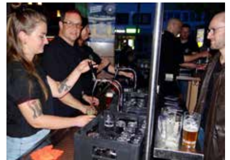
Auch im City-Lokal „Cash“ standen die Zapfhähne nicht still