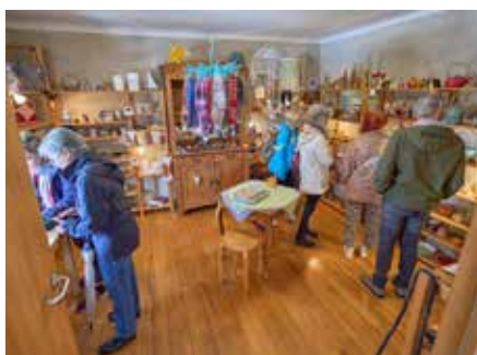
Der Innenraum vom Kleinottweiler Lädchen