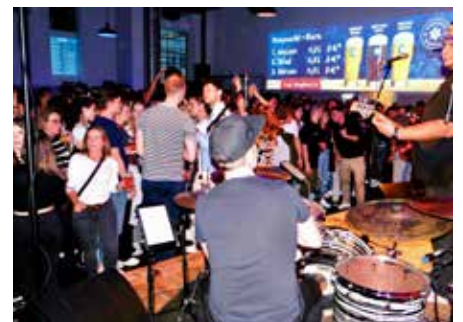
Permanente Hochstimmung bei Livemusik in der Alten Schlosserei der Karlsberg Brauerei

berg-Biere. Gefeierte wurde in diesem Jahr in sieben Gaststätten: Cash, Stehschoppe, Old Dublin, Marktgässchen, Oh!lio, TC Blau Weiss Homburg, Kaya's Burger sowie die Alte Schlosserei, der Biererlebnis-Veranstaltungsort der Karlsberg Brauerei. Hier konnten die neuen Biere bei heißer Live-musik in Brauerei-Atmosphäre getestet