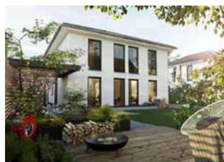
Eine wunderschöne Stadtvilla aus der Gartenperspektive