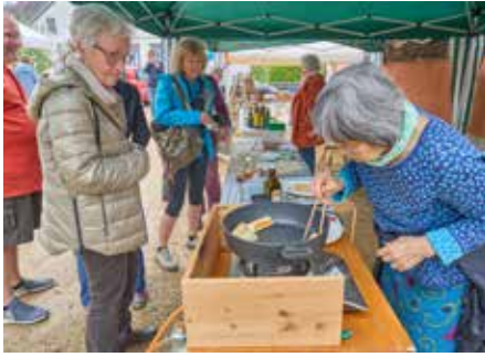
Die leckeren Frühlingsrollen

nicht mehr alleine zu leisten imstande ist, werden diese und ähnliche Aktionen auch in Zukunft weiter vermehrt aussterben. Bis pünktlich zum Festende gegen 16.00 Uhr