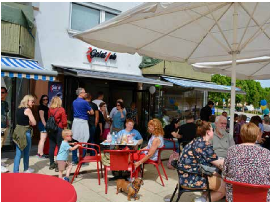
Seit Anfang Mai hat auch Waldmohr eine Gelat!oh-Filiale © se

in Gelat!oh, hier fühlt man sich nicht als Gast, sondern als Teil der Familie. Familie ist ein guter Stichpunkt, denn in der Eismanufaktur wird die traditionelle Eisherstellung, wie sie schon die Großeltern aus Italien praktiziert haben, mit modernen Akzenten weitergeführt. So entstehen aus natürlichen Zutaten auch immer wieder neue und außergewöhnliche Eissorten, die ihresgleichen suchen. „Gewöhnlich gibt's nicht,“ ist sich das Team des Gelat!oh einig, „unser Ansporn ist es, auch aus bekanntem, das Besondere zu machen. Entdecken Sie Klassiker bei uns neu oder entdecken Sie Sorten, die Sie bisher noch nie probiert