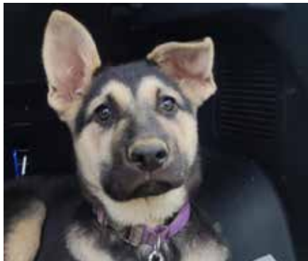
Die kleine Akira ist ein echter Sonnenschein

der Schäferhund ist kein Couchpotato. Er braucht Aufgaben, muss beschäftigt werden und seine Eigenschaften ausleben können. Osteuropäische Schäferhunde gelten als ausdauernde Arbeitshunde mit großem Mut und hohem Leistungswillen. Wer also Freude am Hundesport hat, an Mantrailing, Agility oder ähnlichem, der macht dem Hund eine große Freude. Action, gepaart mit Kopfarbeit lastet den Hund aus und auch Frauchen oder Herrchen haben Freude. In ihren Genen habe