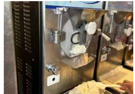
Im Eislabor werden die leckersten Eissorten hergestellt

Kaffeespezialitäten, Tee, Eisgetränke, Alkoholisches und alkoholfreie Getränke an. Gerne sind Hunde in den Standorten Homburg und Waldmohr willkommen und für diese wird Hundeeis angeboten.