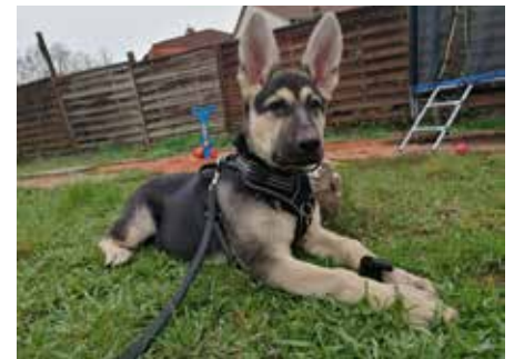
Schon im Welpenalter sind die charakteristischen Merkmale des osteuropäischen Schäferhundes deutlich erkennbar

diese Hunde die Wachsamkeit und den Beschützerinstinkt verankert, Fremden gegenüber sind sie misstrauisch und vorsichtig. Der Osteuropäische Schäferhund muss von seinem Wesen her selbstsicher, selbstbewusst, belastbar, ausgeglichen und nervenfest sein. Der kräftige Hund mit seiner imposanten Körpergröße ist nun nicht gerade der Kuschelhund und eher nicht so für die Couch geeignet. Er ist ein Arbeiter, der sich Frauchen und/oder Herrchen bei guter Erziehung problemlos unterordnet und sie sind treue und anhängliche Be-