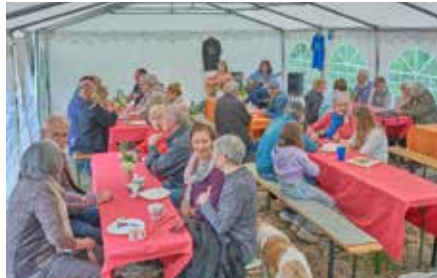
Im großen Zelt spielte das Duo „Times & Tales“ tolle Musik

hielt das Sonnenwetter im Hof hinter der Hausnummer 11 der Homburger Straße in Kleinottweiler und das Team ums „Lädchen“ kann stolz darauf sein, was in den vergangenen Jahren von ihm geleistet wurde. Die Projektgruppe konnte nämlich seit ihrer Gründung 1999 Kinder und Jugendliche mit seelischen Problemen und deren Eltern mit insgesamt 224.000