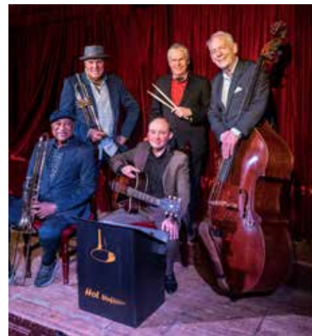
HOT STUFF JAZZBAND legen einen groovigen, erdigen „Mini Big Band Sound“ an den Tag der seinesgleichen sucht

sind entweder an der Musikhochschule Absolventen eines Jazzstudiengangs oder haben sich in besonderem Maße mit Jazzmusik befasst. Der Landesmusikrat Saar als Träger des Projekts versucht dabei stets, die jungen Musikerinnen und Musiker bestmöglich zu fördern. Schließlich gibt es für Jazz-Fans am Samstag, 29. Juni, noch ein