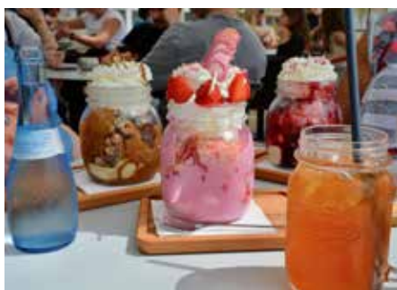
So kann der Sommer schmecken, Nussbecher, Girls-Day-Becher und Amarena-Becher (von links) grüßen aus Waldmohr

nabecher bis hin zum Mangobecher mit Kokoscrunchboom, dem Girls-Day-Becher mit leckeren Erdbeeren oder auch den Espresso-Eis-Cups, die mit köstlichem, italienischem Espresso hergestellt werden, bis hin zu den Leckereien für die Kleinsten bleiben keine Wünsche offen. Aber was