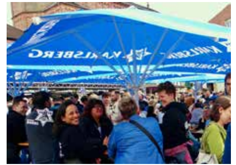
Hochbetrieb auf dem Marktplatz schon bei der Eröffnung der Homburger Braunacht

zur Wahl- und ihr wisst ganz genau, wen ihr nicht wählen sollt.“ Anschließend erwartete die Besucher*innen ein vielfältiges Programm rund um das Thema Bier und jede Menge handgemachte Musik. Live-Musik satt für jeden Geschmack. Hier kamen Musik-Fans voll auf ihre Kosten: Auf dem Historischen Marktplatz spielte nonstop die Band Radiosolid. Und als dort um 20 Uhr die Verstärker ausgingen, ging's in der Homburger Gastronomie erst richtig los: Bis in die späte Nacht herrschte Hochstimmung – mit Liveband oder DJ-Musik und immer dabei die drei neuen Karls-