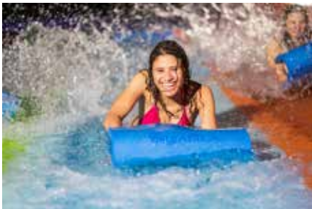
Vikinglop- spritziges Vergnügen