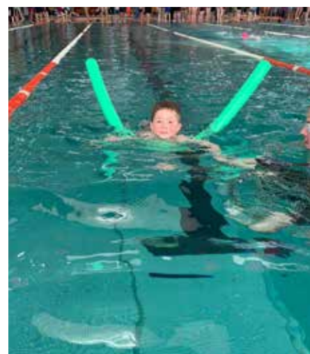
Mit der Schwimmnudel fällt es leichter sich über Wasser zu halten

legende Fertigkeit im Leben aber auch als Sportart in Homburg ist. Erfolgreiche Tradition: Schwimm-Stadtmeisterschaften etablieren sich in Homburgs Sportkalender. Mit der Rekord-Teilnehmerzahl und der begeisterten Resonanz von Teilnehmern, Besuchern und Politik sind die Schwimm-Stadtmeisterschaften in Homburg längst zu einem festen Bestandteil des sportlichen