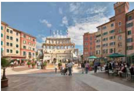
Die Piazza des Colosseo bietet ein großartiges Ambiente

sich an einsame Fjorde im hohen Norden wünscht oder von mediterranen Nächten träumt, die parkeigenen 4-Sterne (Superior) Erlebnishotels verzaubern die Gäste mit ihrer liebevollen Thematisierung und einem ausgezeichneten kulinarischen Angebot. Fünf Poolbereiche und zwei Kinder-Wasserspielplätze laden den gesamten Aufenthalt inklusive An- und Abreisetag zum Erfrischen ein. Großzügige Wellness- und Spa-Bereiche runden den Aufenthalt perfekt ab. 20-jähriges Bestehen feiert im