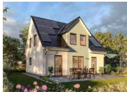
Wohnen mit „Flair“ im Town & Country Haus

grundgutachten, Gründungspolster und Bodenplatte - Bauantrag - Bauleitung durch erfahrene Bauleiter - Massives Mauerwerk aus Porenbetonsteinen - Innen- und Außenputz - Dachziegel, Farbe wählbar - Estrich inkl. Schall- und hochwertiger Wärmedämmung - Energieeffiziente Wärmepumpe mit Warmwasserspeicher - Fußbodenheizung mit