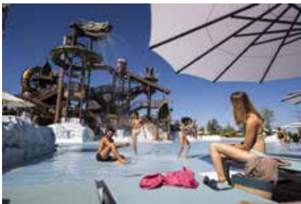
Nasse Erfrischung für die ganze Familie