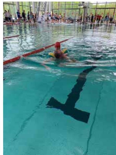
Auch die Kleinsten hatten jede Menge Spaß