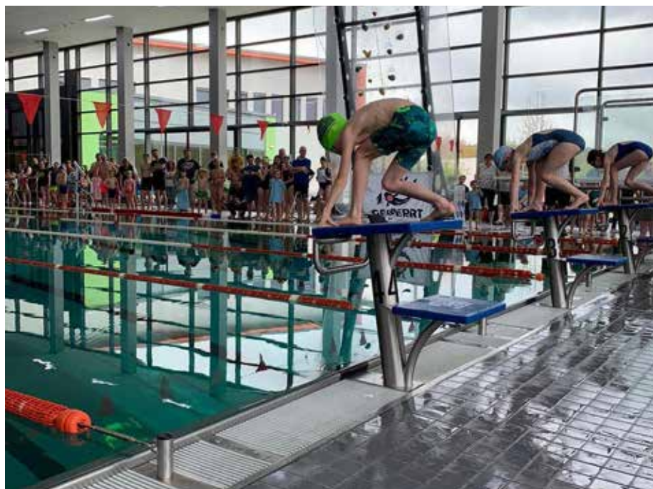
3-2-1- los geht es in das kühle Nass

Sogar Übungsleiter wechselten die Seiten und sprangen als Trainerstaffel ins Wasser, angefeuert von den Seepferdchen und Badenixen, die sie üblicherweise für Wettkämpfe vorbereiten. Die Betreiber des KOI Schwimmbads äußerten sich auf Instagram begeistert: „So viele Teilnehmer*innen und Besucher*innen gab es schon lange nicht mehr!“ Erfolge, Emotionen und vielseitige Wettkämpfe: Jubel für Jung und Alt. Mehr als 120 Mal ertönte die Schiri-Pfeife und gab den Startschuss für über 530 Sprünge in den verschiedensten Strecken und Lagen. Neben sportlichen Leistungen kam der Spaß auch nicht zu kurz: So wurden bei der Medaillenvergabe sowohl die jüngsten Sieger frenetisch beklatscht, die ihre Angst überwunden und ihren ersten Wettkampf bestritten hatten, als auch die älteren Jahrgänge, die zeigten, dass sie's