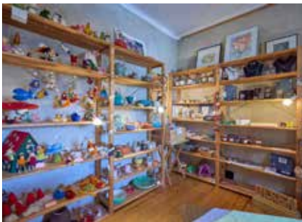
Dinnen im kleinen Lädchen

nicht mehr alleine zu leisten imstande ist, werden diese und ähnliche Aktionen auch in Zukunft weiter vermehrt aussterben. Bis pünktlich zum Festende gegen 16.00 Uhr