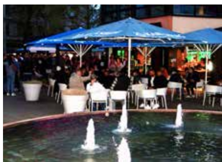
Bei „Kaya's Burger“ war noch spät am Abend im Freien viel los

Auftritt im Portfolio der Marke Karlsberg bekommen. Übrigens, das Gewinnerbier der Braunacht 2023 ist ab sofort exklusiv in ausgewählten Gastronomiebetrieben erhältlich als Ergänzung zu dem beliebten hellen Kellerbier von Karlsberg.