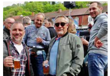
Einstimmung auf eine lange Nacht mit den neuen Karlsberg-Bieren