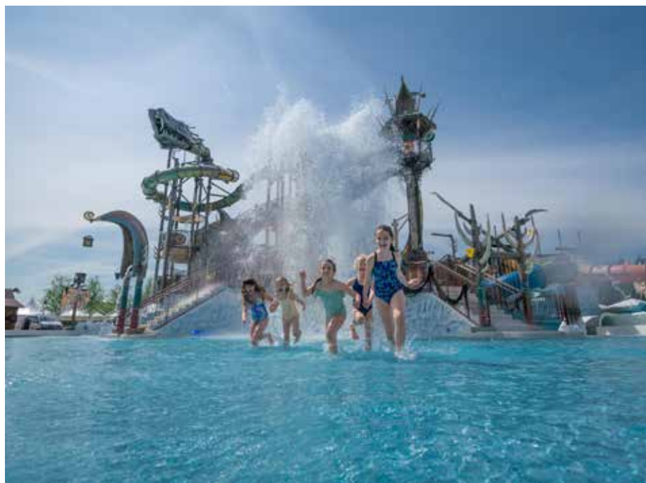
Wasserspaß pur mit Svalgurok

Abkühlung für die ganze Familie. Für echtes Urlaubsfeeling unter badischer Sonne sorgen die Outdoor Rutschlandschaft „Svalgurok“ mit zehn unterschiedlichen Rutschen und über 100 verschiedenen Spielmöglichkeiten sowie der nordische Sandstrand „Dynströnd“ und der Kinderbereich „Snorri Strand“. Wer es etwas ruhiger mag, findet im exklusiven Ruhebereich „Hyggedal“ eine Oase der Entspannung mit atemberaubendem Blick über die Wasserlandschaft. Auf 1.000 Quadratmetern warten unter anderem gemütliche Liegemöglichkeiten, drei textiltfreie Holzsaunen, ein Dampfbad und eine große Außenterrasse auf die Gäste. Sommer-