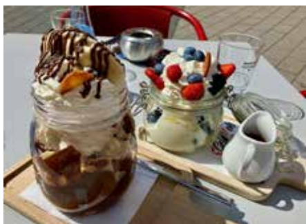
Liebevoll hergestellt aus besten Zutaten können Sie leckere Eisbecher, wie hier zum Beispiel einen Bananenbecher und einen Joghurtbecher genießen

Wirft man einen Blick in die Eiskarte im Gelat!oh in der Homburger Eisenbahnstraße, fällt die Auswahl schwer. Die angepriesenen Eisbecher lassen die Gäste schon Gutes erahnen, hier ist wirklich für jeden Geschmack etwas dabei. Vom Spaghettieis über den beliebten Amare-