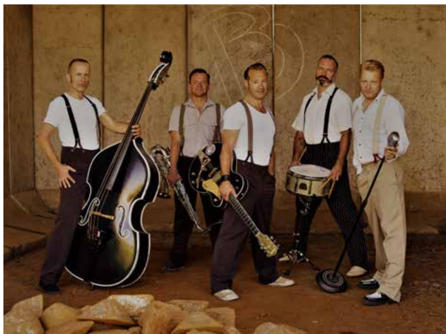
Boppin'B aus Aschaffenburg (gegr. 1985), sind DIE erfolgreichsten Repräsentanten und Botschafter des Rock N Roll und Rockabilly in Deutschland

Elektro-Pop-Beats von Bands wie Depeche Mode und INXS bis hin zu kultigen Hits von Prince und Nik Kershaw sind in ihrem Programm. Eine Woche später, am 28. Juni folgt mit ROX! eine niederländische ROXETTE Tributeband, die es sich zur Aufgabe gemacht hat, die Hits dieses großen schwedischen POP-Ensembles auf die Bühne zu bringen: "The Look", "Listen To