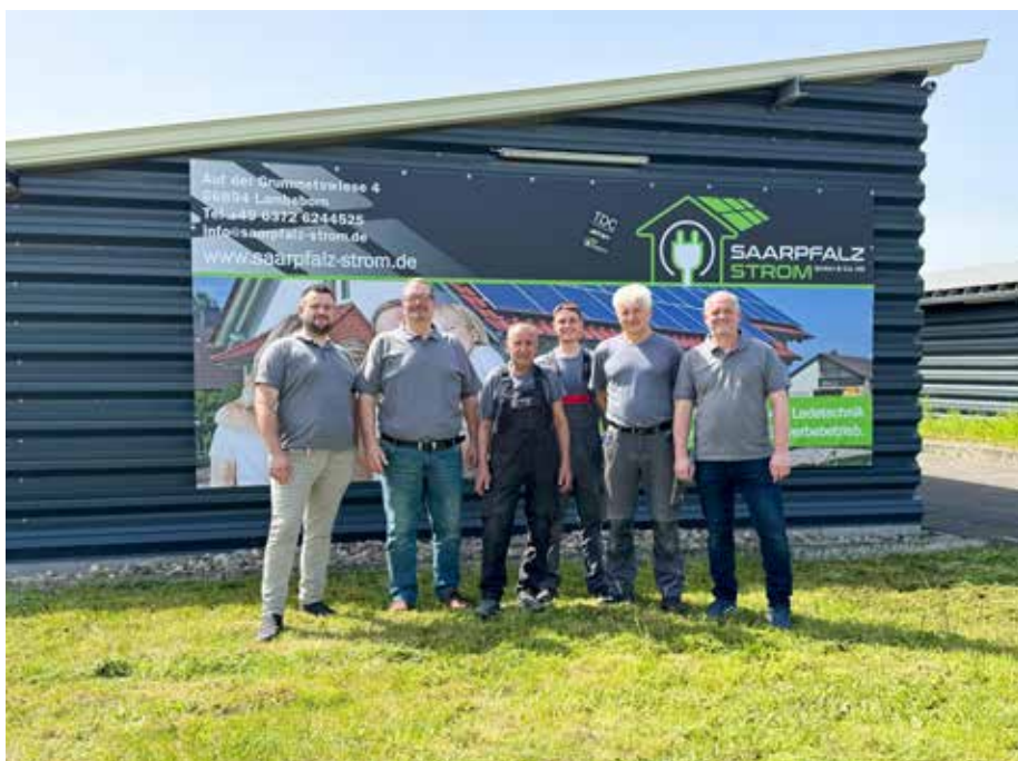
Das kompetente Team der Saarpfalz-Strom GmbH & Co. KG

Das spiegelt sich nicht zuletzt auch in der rasanten technologischen Entwicklung zur nachhaltigen Stromgewinnung und -Speicherung wider. Wer mit dem Gedanken spielt, die eigene Energieversorgung selbst in die Hand zu nehmen, findet in der Saarpfalz-Strom GmbH & Co. KG den perfekten Partner. Hier nimmt man sich Zeit für seine Kundschaft, geht auf die individuellen Bedürfnisse im Einzelfall ein und arbeitet ausschließlich mit modernster Technologie in Spitzenqualität. Egal ob Solar oder Photovoltaik, die Anlagen entsprechen stets den neuesten Anforderungen in den Bereichen Technik, Sicherheit und Langlebigkeit, so-