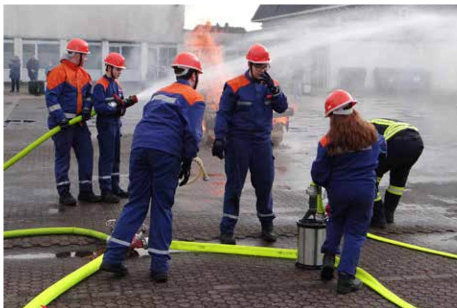
Das richtige Verlegen von Schläuchen wurde von den Jugendlichen geübt

veranstaltung auch in anderen Szenarien gefordert. Der Übungstag begann mit einer Türöffnung, bei der eine vermisste Person aus einer Wohnung befreit wurde. Ferner ging es um eine Tierrettung bei der zwei Katzen von einem Baum heruntergeholt wurden. Außerdem galt es einen Flächenbrand in Schach zu halten. Ebenfalls im Verlauf des Tages nahmen die Jugendlichen an einem Feuerlöschertraining bei der Firma Michelin teil. Ebenfalls im Programm war eine Personenrettung bei einem simulierten Verkehrsunfall. Für die Koordination der Übungen waren sowohl komplexe moderne technische Hilfsmittel als auch unterschiedliche Spezialfahrzeuge im Einsatz. Die abschließende gemeinsame Übernachtung zusammen mit den Betreuern in der Homburger Feuerwache wurde vom Feuerwehrynachwuchs gern angenommen und war ein zusätzliches Gemeinschaftserlebnis. Während der Übungen wurden nicht nur technische Fähigkeiten geschult, sondern auch wichtige Soft Skills wie Kommunikation, Entscheidungsfindung und Stressbewältigung entwickelt. Durch die Zusammenarbeit in einem Team lernten die Jugendlichen, sich aufeinander zu verlassen und effektiv zu kommunizieren, was ihnen nicht nur in der Feuerwehr, sondern auch im späteren Leben von großem Nutzen sein kann.