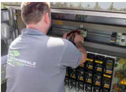
Der Elektromeister am Werk

Falls auch Sie sich für eine Zusammenarbeit mit der Saarpfalz-Strom GmbH & Co. KG interessieren, finden Sie viele weitere Informationen rund um nachhaltige Energieversorgung und die entsprechende technische Infrastruktur auf der Website des Unternehmens unter saarpfalz-strom.de .