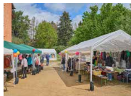
Der Essensstand und die Flohmarktstände

Straße 11, 66450 Bexbach/Kleinottweiler geöffnet. Hier konnten Besucherinnen und Besucher allerlei Kunstwerke aus Holz, Ton, Wolle, Filz, Stoff sowie Schmuck, Geklopptes, Bilder, Kunstkarten, Honig, Marmelade, Bliesgauprodukte und auch Kosmetik käuflich erwerben. Alles zugunsten der Projektgruppe. Die „Projektgruppe Kinder und Jugendliche“ ist Teil des Vereins „Psychosoziale Projekte Saarpfalz