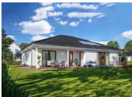
Wunderschön ist dieser Bungalow mit überdachter Terrasse

Häuser werden schlüsselfertig übergeben und verfügen über die sogenannte Vollausstattung, die aus folgenden Komponenten besteht: Effizienzhaus 55 im Standard, Effizienzhaus 40 gegen Aufpreis - Boden-