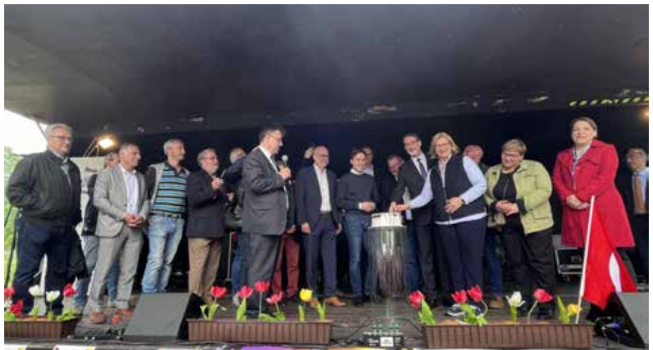
Wie in jedem Jahr gab es auch eine Torte, die gemeinsam von den Schirmherren, Organisatoren und politischen Vertretern angeschnitten wurde

Ein schönes Fest, das seinen festen Platz im Veranstaltungskalender der Universitäts- und Kreisstadt Homburg hat.