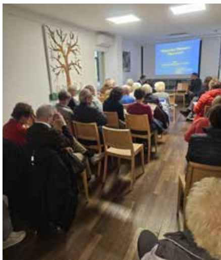
Der Vortrag „Demenz – was nun?“ fand in den Räumen der Tagespflege Villa Kaiser in der Kaiserstraße in Homburg, statt