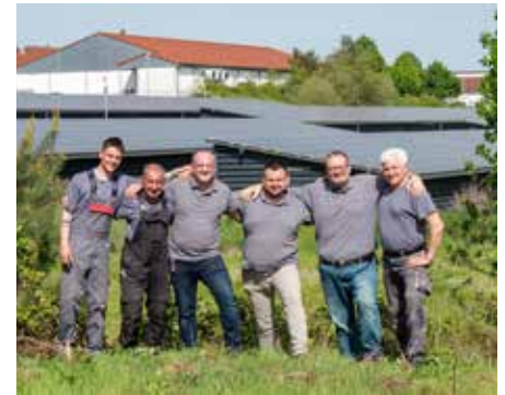
Das motivierte Team der Saarpfalz-Strom GmbH & Co. KG

ellen Stand der Technologien zu sein, ist es der Firma Technische Dienstleistung Collet bzw. der Saarpfalz-Strom GmbH & Co. KG über die Jahre gelungen, mehr als 500 Projekte erfolgreich umzusetzen und damit letztlich auch - damals wie heute -