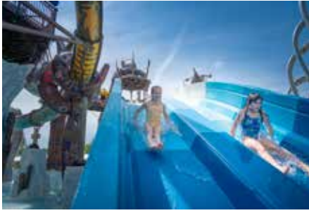
Rutschen macht besonders viel Freude