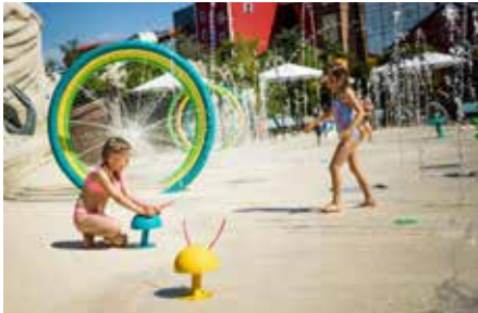
Snorri-Strand Vergnügen für die Kleinsten