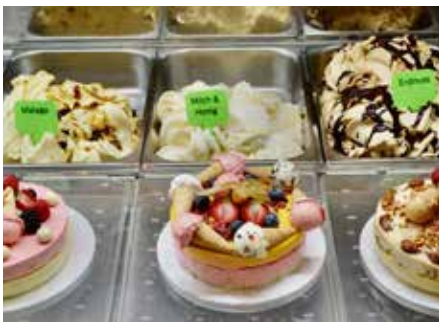
Leckere Eistorten für alle Anlässe, wie zum Beispiel Geburtstage oder Hochzeiten können Sie ganz nach Ihren Wünschen im Gelat!oh herstellen lassen © se

minzschoko richtig und dann wäre da noch ein grandioses Tiramisu-Eis, das sich neben dem Zuppa inglese-Eis nicht verstecken muss. Aber ganz egal welche Vorlieben Sie bei der kalten Köstlichkeit haben, aus-