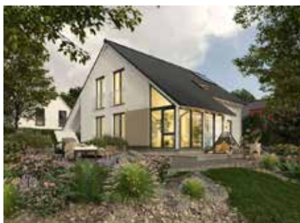
Das Haus „Bodensee“ mit Wintergarten und Carport

Für neue Standards in der Baubranche sorgte Town & Country Haus mit der Einführung des im Kaufpreis eines Hauses enthaltenen Hausbau-Schutzbriefes, der das Risiko des Bauherrn vor, während und nach dem Hausbau reduziert. Alle