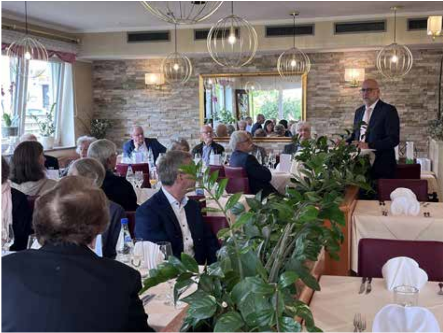
Beim gemeinsamen Mittagessen fanden einige gute und wertvolle Gespräche statt