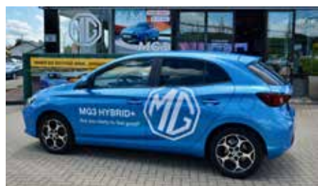
Formschön und schnittig zeigt sich der MG3 Hybrid+

1502 mm hoch. Er verfügt über ein Kofferraumvolumen von 241/293 (Blockmesskapazität / Wassermesskapazität, l) und wenn die Sitzbänke umgeklappt sind, hat er stolze 983 l Volumen. Das 3-Gang-Automatikgetriebe sorgt für eine komfortable Fahrweise, denn es stellt die bestmögliche Kombination aus Leistung und Effizienz bereit. Das fortschrittliche Hybrid+ System, bestehend aus dem 1,5 l Benzinmotor und einer Hochvoltbatterie, sorgt für einen niedrigen Kraftstoffverbrauch und geringere CO 2 -Emissionen, während der Fahrkomfort auf einem hervorragenden Level ist. „Der neue MG3 Hybrid+ schal-