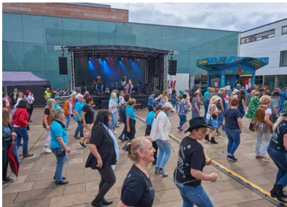
Die Line-Dancer zur Musik von der Band „Country to go“

wagen rundherum, konnte man sich einen „Homburger Mehrweg-Maifestbecher“, wie auch schon in den vergangenen Jahren, mit allerlei Getränken auffüllen. Wer keinen Becher hatte, konnte diesen für 2 Euro einmaliger Bechergebühr - quasi als Beitrag zu den Eventkosten und für die Mu-