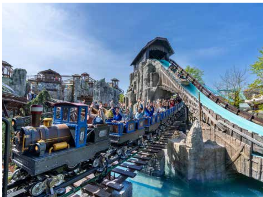
Die charmante Familienachterbahn bringt viel Freude

flair für die einzigartige Darbietung. Der ultimative Wasserspaß für die ganze Familie Wer sich selbst in die Fluten stürzen möchte, findet in der ganzjährig geöffneten Wasserwelt Rulantica neben zahlreichen