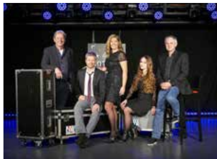
Die Reihe Querbeat beginnt mit „No Matter What“