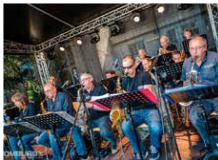
Weiter geht es dann am Samstag, 13. Juli mit der Uni-Bigband, einem Urgestein der Homburger Universitätsklinik