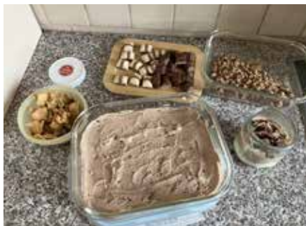
Nun geht es ans Schichten

weils drei dunkle und drei Weiße haben wir in gleichgroße Stücke geschnitten und zur Seite gestellt. Die restlichen Buenos haben wir kleingehackt und auch zur Seite gestellt. Nun ging es an die Creme. Hierzu haben wir die 400 g Sahne zusammen mit der Mascarpone in eine Schüssel gegeben