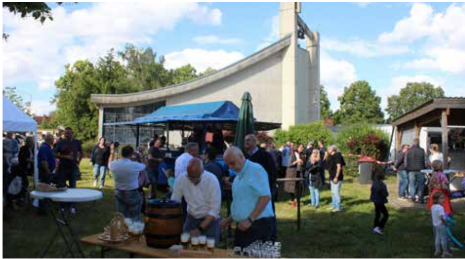
Das Fest war sehr gut besucht