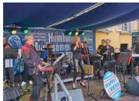
„Happy Sound“ spielte auf dem historischen Marktplatz

Bildunterschriften, da es hier den Rahmen sprengen würde, alle der über 20 Gruppen einzeln aufzuzählen. Manche Bands durften laut Programmflyer des Veranstalters