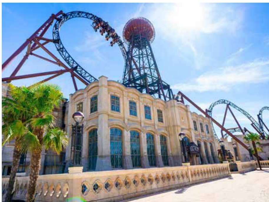
Besucher entdecken im Sommer 2024 den neuen Themenbereich Kroatien

vera powered by Rimac“. Die Achterbahn schlängelt sich mit zahlreichen neuartigen Fahrelementen – unter anderem steht man sieben Mal über Kopf – durch eine authentische kroatische Landschaft. Heller Kalkstein, Ruinen, Mauerstücke sowie eine Vielzahl von Pflanzen, darunter auch ein 800 Jahre alter Olivenbaum, sorgen für mediterranes Flair. Die Geschichte des im heutigen Kroatien geborenen Wissenschaftlers und Erfinders Nikola Tesla, der seinen Traum von der drahtlosen Fernübertragung elektrischer Energie verwirklicht, zieht sich als roter Faden durch Attraktion und Themenbereich. Hier lockt auch die neue Ausstellung „Croatian Inspiration“