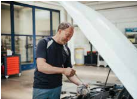
Diagnosemechaniker bei der Arbeit