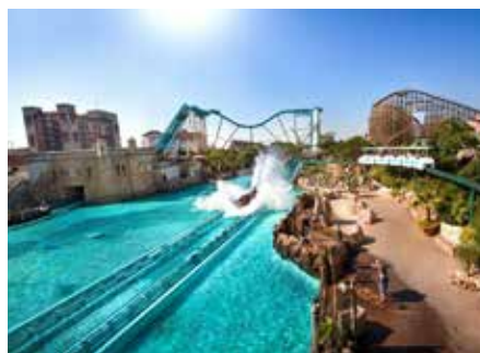
Erfrischung pur und eine postkartenreife Kulisse garantiert die Wasserachterbahn „Atlantica SuperSplash“

Cocktails, begleitet von erstklassigen Live Acts, um alle Sinne zu begeistern. Nach der Experience feiern die Gäste eine unvergessliche Nacht mit modernen DJ-Beats in der Bar. Himmlische Nächte in den Europa-Park Hotels Wenn die Füße von den