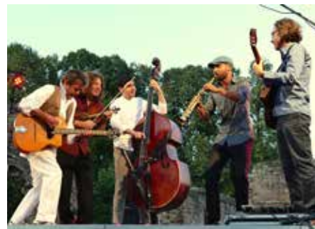
Am dritten Samstag im Juli ist zum ersten Mal das Absinto Orkestra aus Mainz beim Jazzfrühschoppen zu hören