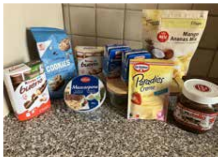
Diese Zutaten benötigt ihr für unser leckeres Dessert

Wir alle lieben Nachtisch, oder etwa nicht? Also wir sind uns ziemlich sicher, dass ihr leckeren Nachtisch mindestens so mögt wie wir und darum haben wir uns im Internet inspiriert und für euch einen KINDER Bueno Nachtisch kreiert.