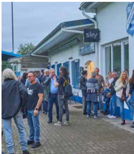
Draußen vor dem Vereinsheim des SV Schwarzenbach 1921 e.V.

Voodoo Circle“ und „Primal Fear“. Als Vorband bestritt er mit „Sinner“ bei Auftritten von „Whitesnake“, „Deep Purple“ und „Savatage“. Mit am Start bei dem 2-stündi-