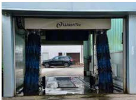
Die moderne Waschanlage säubert Ihr Auto schonend und bietet den optimalen Service

Sie finden das Autohaus Wunn in der Rathausstraße 64-66 in 66914 Waldmohr. Für Sie ist die Werkstatt von Montag bis Freitag von 7.30 Uhr bis 17.00 Uhr geöffnet, samstags ist man dort von 8.00 Uhr bis 12.00 Uhr für Sie da. Der Verkauf von Neu- und Gebrauchtwagen ist Montag bis Freitag von 8.00 Uhr bis 17.00 Uhr und an Samstagen von 9.00 Uhr bis 12.00 Uhr geöffnet, sowie nach Vereinbarung. Gerne können Sie sich im Internet unter www.autohauswunn.de informieren. se