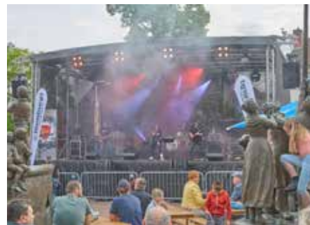
„Live Wire“ aus St. Wendel spielten am Sonntag auf der Rockbühne

allerorten hatten die vielen Kinder und Jugendlichen zusammen mit den Älteren ihren Spaß. Um einen Eindruck zu den einzelnen Akteuren und generell vom Maifest zu bekommen, sehen Sie, liebe Leserinnen und Leser, die Bandnamen unterhalb der hier veröffentlichten Fotos als