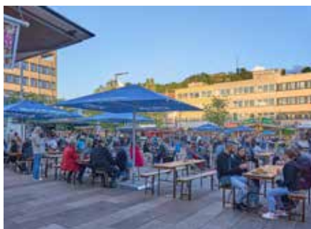
Das Publikum am Freitagabend auf dem Christian-Weber-Platz

siker - käuflich erwerben. Ganz im Sinne des Umweltschutzes. Neben den zahlreichen musikalischen Darbietungen und den gut gelaunten Linedancern am Sonntag konnten sich auch einige Tanzgruppen präsentieren. Hierzu gehörten zum Beispiel verschiedene Schautanzgruppen der HNZ (Homburger Narrenzunft) und deren Ballettabteilung. Viele Eltern machten hiervon natürlich Fotos und Videoclips und