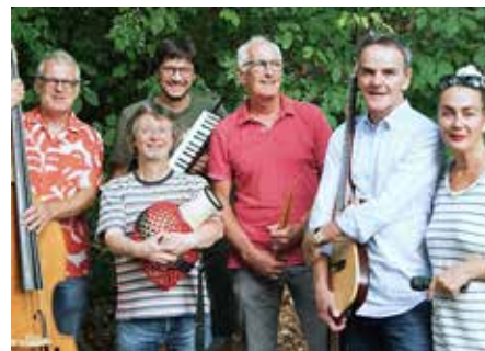
Am 27. Juli nimmt die Formation „bossa'68“ die Besucher des Jazzfrühschoppens mit auf eine Reise an die Copacabana

Jazzfrühschoppens mit auf eine Reise an die Copacabana. Ihr Name ist Programm: Aus Rio de Janeiro kommen die meisten Evergreens des Musikangebots: Ob es das Girl from Ipanema ist oder der Tanz-Hit Mas que nada – immer verströmt der Bossa Nova gleichermaßen Sehnsucht und gute Laune. Zur Abwechslung erlaubt sich bossa'68 aber auch mal einen Abstecher in Richtung Soul oder Easy Listening.