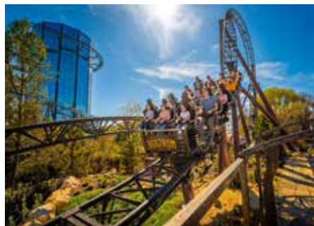
Absolutes Highlight ist dort der frisch eröffnete Multi Launch Coaster „Voltron Nevera powered by Rimac“

plett neu ist zudem der „Yomi Abenteuer Trail“: Der abenteuerliche Höhenweg mit Hängebrücken, vielen Kletterelementen und zwei Rutschen führt die Gäste auf bis zu zwölf Meter hohen Felsen hin zum Shop „Edelstein-Grotte“. Im Französischen Themenbereich erleben die Gäste bei „Eurosot Coastality“ ein neues Virtual-Reality-