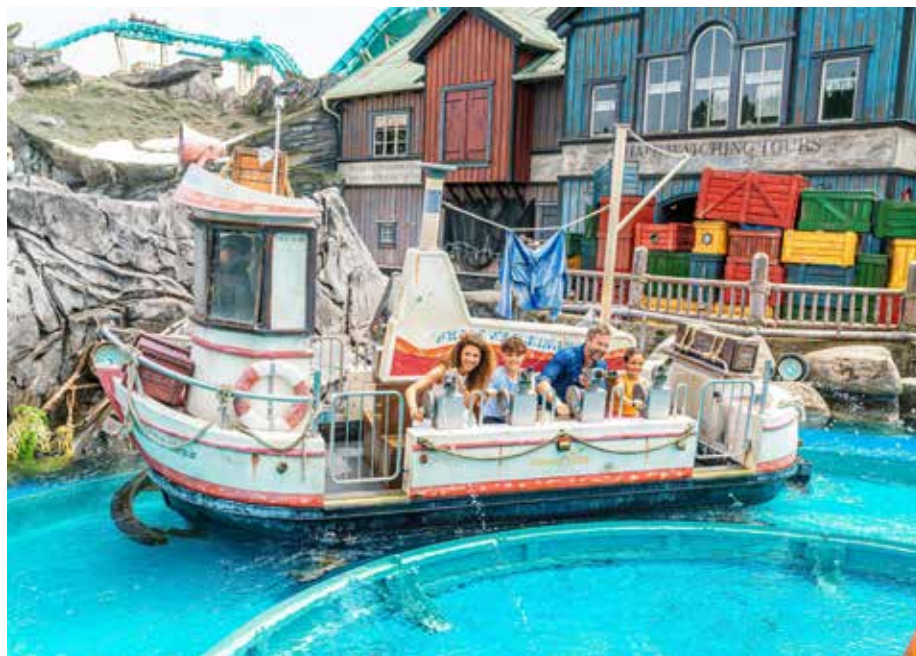
Wasserspaß für die ganze Familie in Whale Adventures

träumt, die parkeigenen 4-Sterne (Superior) Erlebnishotels verzaubern die Gäste mit ihrer liebevollen Thematisierung und einem ausgezeichneten kulinarischen Angebot. Fünf Poolbereiche und zwei Kinder-Wasserspielplätze laden den gesamten Aufenthalt inklusive An- und Abreisetag zum Erfrischen ein. Großzügige Wellness- und Spa-Bereiche runden den Aufenthalt perfekt ab. 20-jähriges Bestehen feiert im Sommer das Hotel „Colosseo“, erbaut im Stil des historischen Rom. So werden die