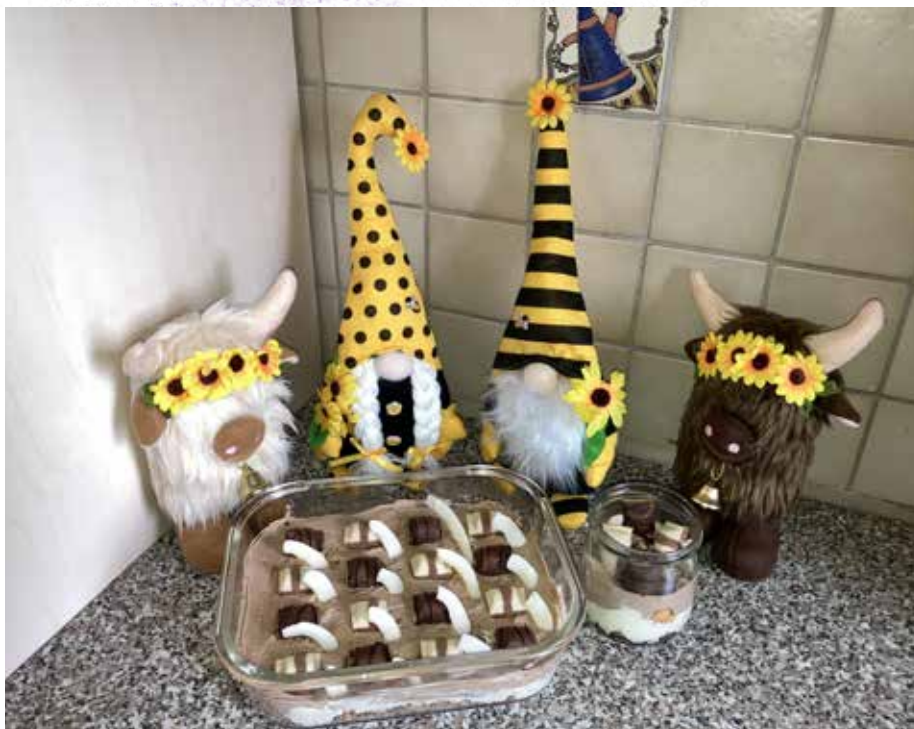
Unser leckeres KINDER Bueno Dessert solltet ihr unbedingt probieren

Wie immer stellt ihr euch alles bereit. Ihr könnt den Nachtisch komplett in eine große Form geben und dann später auf Dessertteller verteilen oder ihr stellt euch Gläser bereit, in die ihr den Nachtisch portionsweise abfüllt. Je nach Größe der Gläser reicht unsere Mengenangabe für etwa 6 Gläser aus. In unserer Version haben wir uns für die exotischen Trockenfrüchte entschieden, die wir zuerst einmal klein geschnitten haben. Dann haben wir die Cookies zerkrümelt und unten in die Form gegeben (bei den Gläsern auch den Boden bedecken). Anschließend haben wir alle KINDER Buenos ausgepackt, je-