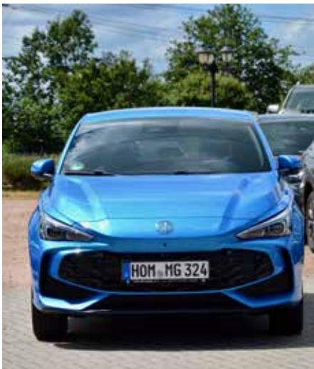
Der MG3 Hybrid+, Ihr idealer Begleiter in der Stadt und über Land