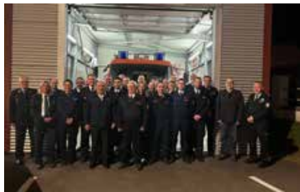
Mannschaftsfoto des Löschbezirks

auf die gezeigte Stärke unterstützten die Kameradinnen und Kameraden seit Kurzem auch ab Einsatzstichwort Brand 4 in Teilen der Innenstadt, der Uniklinik und anderen Objekten mit einem erhöhten Gefährdungspotenzial. Besondere Ereignisse in den zurückliegenden Monaten