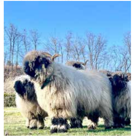
Im Wiesental bei Dudweiler / Herrensohr leben Wangari, Tyrolia and friends

Gebirgen, aber man kann sie auch sehr gut hier bei uns halten. Schwarznasenschafe lieben es draußen zu sein, aber es ist auch wichtig ihnen einen Stall anzubieten, der sie im Winter vor zu viel Kälte, aber im Sommer ebenso vor der Hitze schützen kann. Wichtig ist es immer, dass sie genügend Wasser auf ihrer Weide haben. Und je nach Beschaffenheit der Weide muss man regelmäßig nach ihren Klauen schauen, diese sollten je nach Feuchtigkeit des Bodens alle fünf bis sechs Wochen gepflegt werden. In der Herde haben die Tiere einen guten Zusammenhalt und eine strenge Rangordnung, die immer wieder neu geklärt wird. Die Mutterschafe küm-