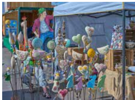
Hier wurden viele Garten- und Pflanzenstecker angeboten

jene Info-Broschüre aus, welche schon ab März bei der Homburger Tourist-Info zur Verfügung stand. Hier auf fanden sich sage und schreibe 73 (!) verzeichnete ausstellende Verkaufsstände. Von der Kreis- und Universitätsstadt Homburg war dieser Flyer gewohntermaßen übersichtlich mit all den Namen und Adressen der jeweiligen Standbetreiber versehen worden und