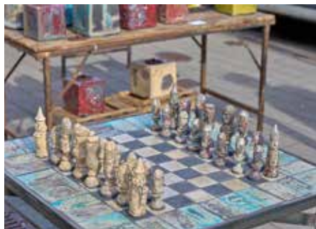
Dieser Schachttisch wirkte wie aus einer anderen Epoche