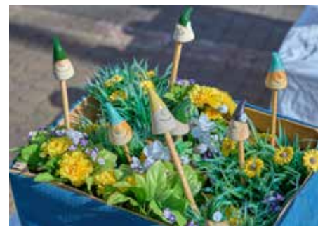
Kleine Wichtel strecken hier den Kopf empor