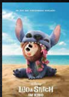
Lilo & Stitch ab/am 22.05.2025