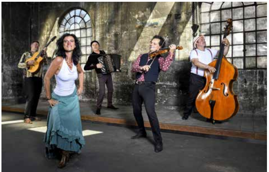
Zur Eröffnung dieser Reihe am 31. Mai 2025 präsentiert die Gruppe Foaie Verde emotionsgeladene Balkan-Folkmusik, gemischt mit Gypsy-Jazz und eigenen Kompositionen