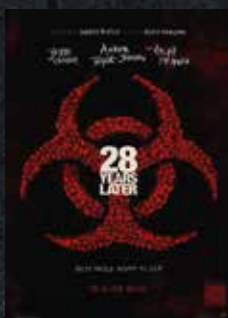
28 Years Later ab/am 19.06.2025