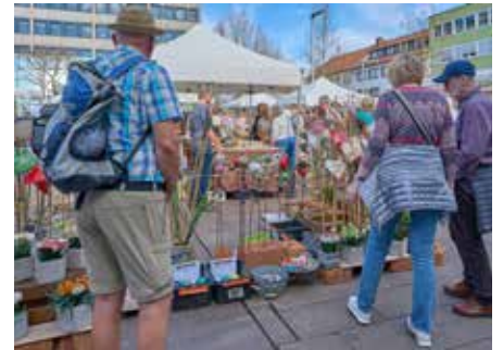
Auf dem Christian Weber-Platz