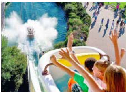
Spritziges Vergnügen in nostalgischen Metallbadewannen bietet eine der höchsten Wildwasser-Schussfahrten Europas

Die preisgekrönten Achterbahnen „Voll-dampf“ und „Hals-über-Kopf“ lassen den Adrenalinspiegel in die Höhe schnellen. Für alle, die es nicht ganz so abenteuerlich angehen möchten, stehen zahlreiche Familienattraktionen und spritzige Wasserschussfahrten bereit. Neu 2025: Im