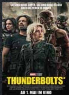
Thunderbolts ab/am 01.05.2025