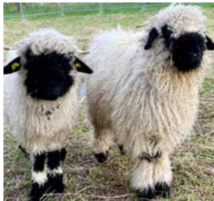
Sie sind einfach herzerzallerliebt, die Schwarznasen vom Wiesental

lichen Tieren. Charakteristisch für diese wunderschönen Tiere sind die schwarzen Beine und das schwarze Gesicht mit den schwarzen Ohren. Die weiblichen Tiere haben eine schwarze Schwanzpartie. Zur hellen, dichten Wolle, die den Rest des Körpers bedeckt, sehen die schwarzen Stellen äußerst putzig aus und so hat man auch optisch wahre Freude an den schönen Schafen. Natürlich müssen, wie die meisten Schafrassen, auch die Walliser regelmäßig geschoren werden und die Schafe liefern ca. vier Kilogramm Wolle pro Jahr. Die männlichen Tiere nennt man Böcke oder Widder und sie werden etwa 100 Kilogramm schwer, die weiblichen Schafe sind etwas leichter mit bis zu 80 Kilogramm, sie nennt man auch Auen oder Zibben. Ursprünglich leben die genügsamen Tiere in