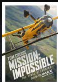
Mission: Impossible – The Final Reckoning ab/am 22.05.2025