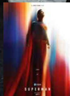
Superman ab/am 10.07.2025