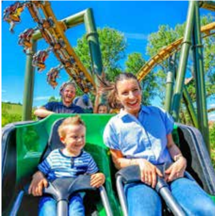
Volldampf - Bei der Familien-Achterbahn geht es nicht nur vorwärts, sondern auch rückwärts