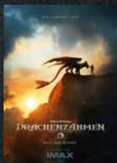
Drachenzähmen leicht gemacht ab/am 12.06.2025