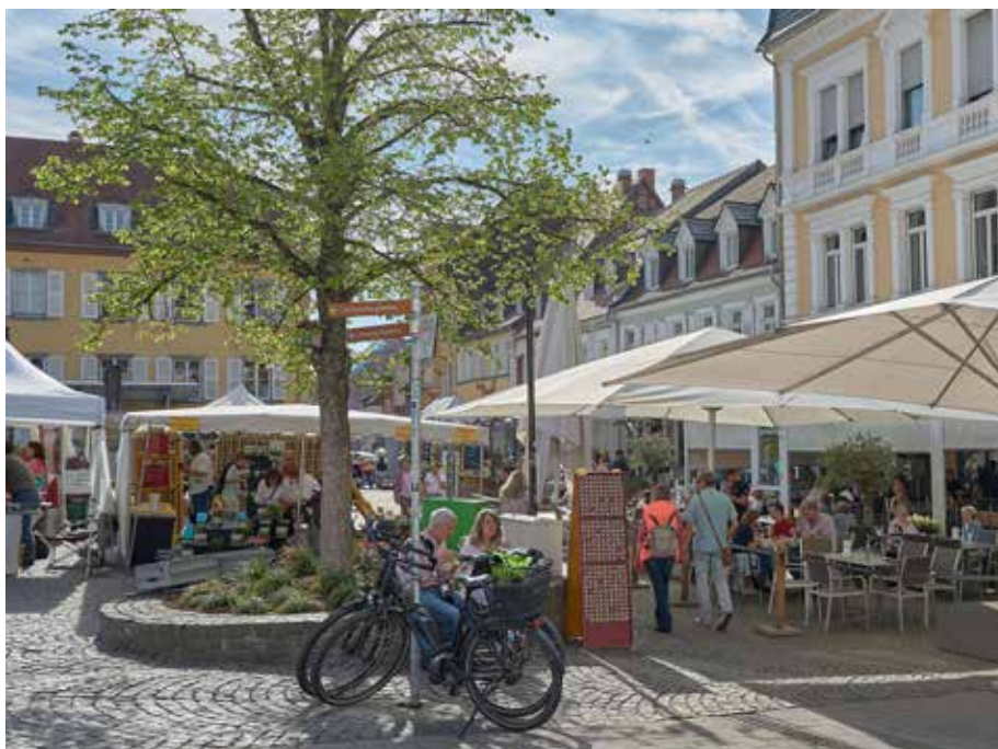
Bei schönem Wetter kamen manche Besucher mit dem Fahrrad zum Keramikmarkt

Für jeden Geschmack gab es hier etwas zu finden. Die Talstraße war eigens für den 2-Tage-Markt ab der Gerberstraße/Saarpfalz-Center gesperrt worden, um den Verkehr vom Marktgeschehen ganz fernzuhalten. Auch lag erneut an den Ständen