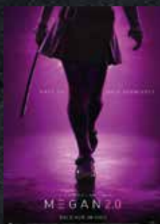
M3GAN 2.0 ab/am 26.06.2025