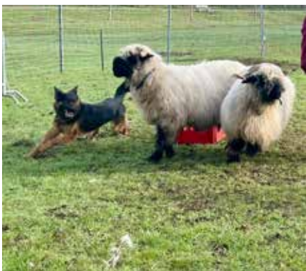
Die Hunde hüten die Schafe, also keine Angst, es passiert ihnen nichts

der Schweiz beheimatet sind. Durch ihre eigenwillige Farbgebung unterscheiden sie sich von anderen Schafrassen und sie verfügen über spiralförmig gedrehte Hörner, diese wachsen bei männlichen und weib-