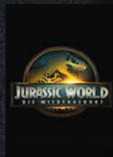
Jurassic World: Die Wiedergeburt ab/am 02.07.2025