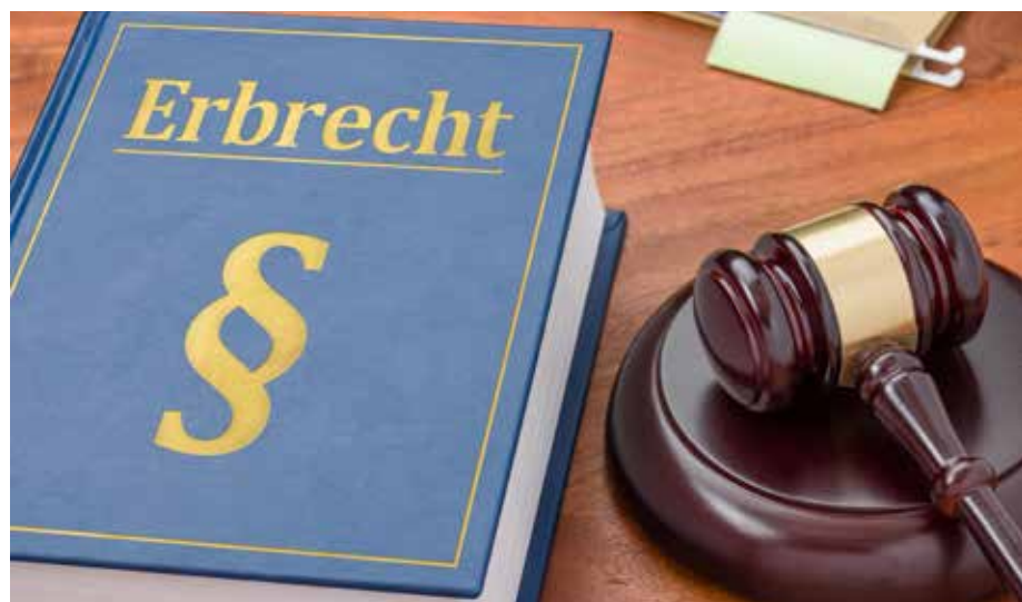
Gesetzbuch mit Richterhammer - Erbrecht

Freilich betragen die Erbschaftsteuerfreibeträge für nicht verheiratete Lebensgefährten und für Geschwister und deren Abkömmlinge (also Neffen u. Nichten) lediglich 20.000 €! Bei diesen Gestaltungen betreffend lebzeitiger Übertragungen, namentlich aber auch bei der Errichtung von Testamenten jedweder Art unter Einbezug einer Erbschaftsteuer-Optimierung, muss unbedingt fachanwaltlicher Rat einer Fachanwältin/eines Fachanwalts für Erbrecht eingeholt werden. So viel im Überblick zur „Enträtselung“ der ominösen Zehn-Jahres-Fristen!