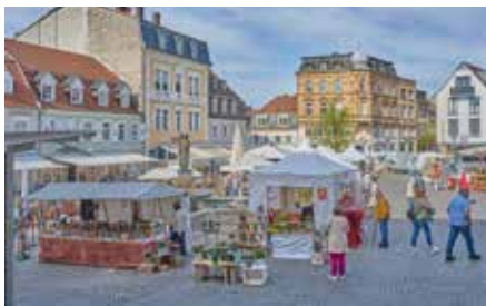
Der Keramikmarkt mit seinen Verkaufsständen auf dem historischen Homburger Marktplatz