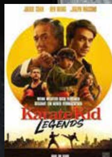
Karate Kid: Legends ab/am 29.05.2025