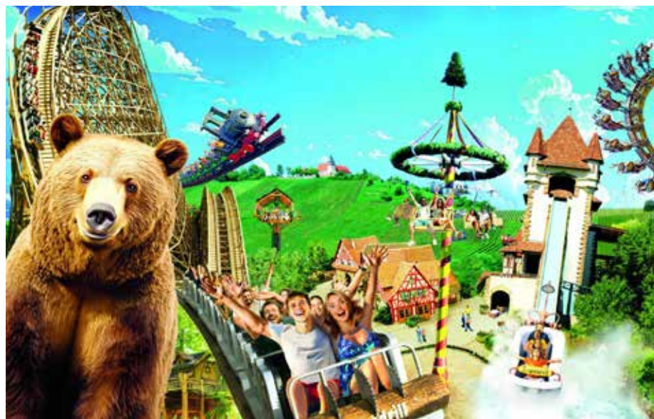
Wer Spaß und Spannung für die ganze Familie sucht, wird im Erlebnispark Tripsdrill bei Stuttgart fündig

Wartebereich der Riesenschaukel „Wilde Gautsche“, die im Stil eines historischen Verlade-Krans gestaltet ist, erwartet die Besucher eine humorvolle Show mit dem typisch schwäbischen Witz von Tripsdrill.