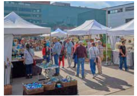
Viele waren gekommen, um die farbenfrohen Stände zu begutachten