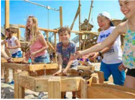
Die Spielewelt „Sägewerk“ ist einer der größten Abenteuerspielplätze Süddeutschlands