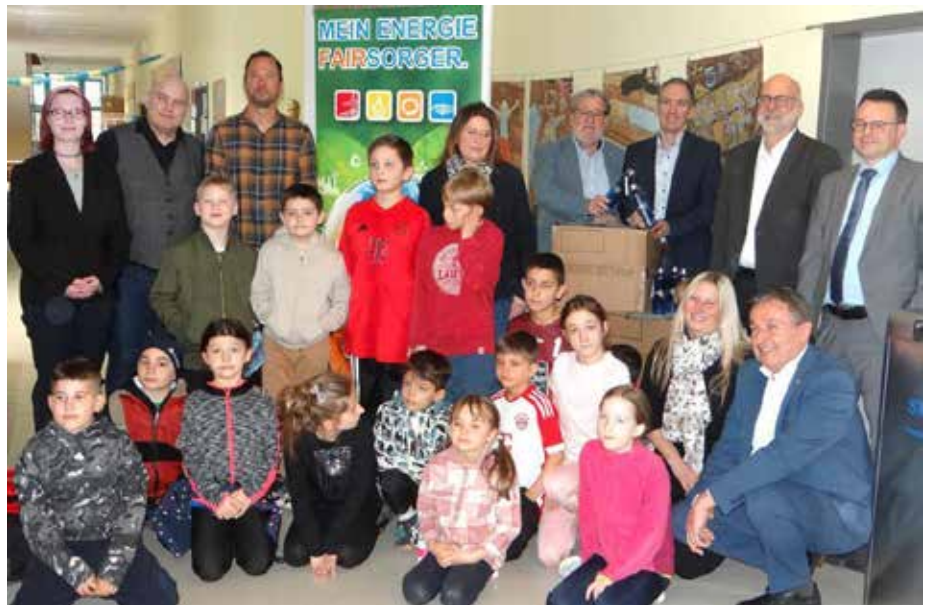
Große Freude bei der Übergabe von Trinkwasserspender bei den Offiziellen und den Schülerinnen und Schülern