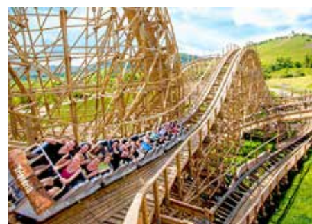
Brettern Sie mit über 80 Sachen mit der Holzachterbahn durch die riesige Sägemühle

Übrigens: Tripsdrill wurde mit dem Parkscout Publikums Award 2024/2025 in der Kategorie „Bestes Preis-Leistungsverhältnis“ ausgezeichnet. Im Eintritt für den Erlebnispark ist das zugehörige Wildparadies bereits enthalten. Hier kann man über 60 verschiedene Tierarten erleben. Täglich, außer freitags, finden außerdem die moderierten Fütterungen bei den Fischottern sowie bei Wolf, Luchs, Bär & Wildkatze und die Flugvorführungen in der Falknerei statt. Zu Erkundungstouren laden Wald-erlebnispfad, Barfußpfad, Abenteuerspielplatz und der neue Murren-Spaß ein.