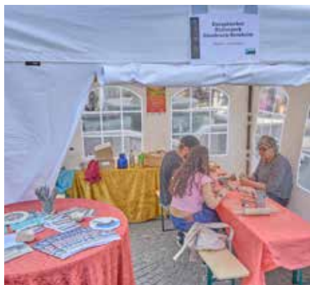
Beim Stand „Europäischer Kulturpark Bliesbruck-Reinheim“ gab es Mini-Workshops zum Thema Töpfern mit Lehm

und auf dem alten Hallenbad-Parkplatz besuchen. Auf die eine oder andere Weise zog es also an diesem Wochenende viele Besucher in die Stadt.