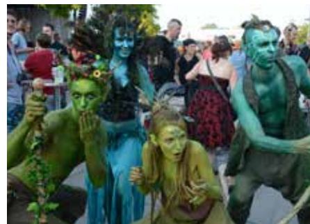
Einfach herrlich diese Vielfalt der fabelhaften Wesen

es Heftche ®: Wir selbst haben diese Veranstaltung bisher immer als die friedfertigste und bunteste Veranstaltung