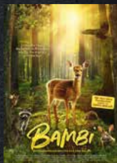
Bambi – Eine Lebensgeschichte aus dem Wald ab/am 01.05.2025