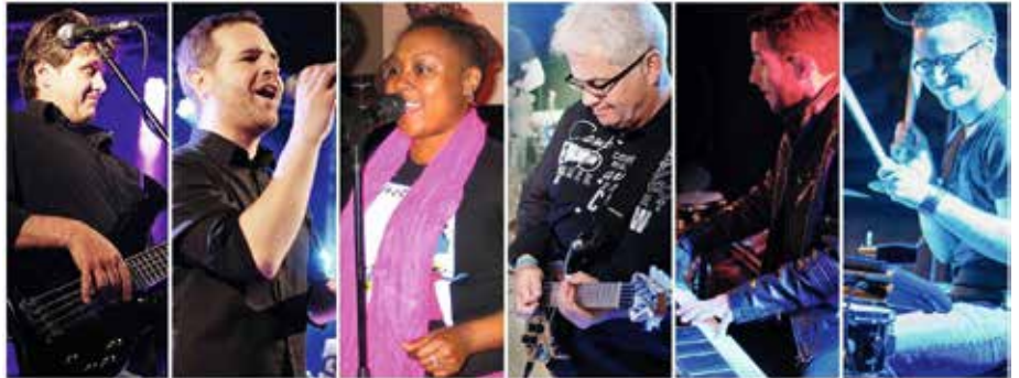
„Querbeat“ wird eröffnet von Bixi Chicks, einer Cover Band

diese Veranstaltungsreihe am Freitag, 30. Mai 2025 mit dem Auftritt der Bixi Chicks, einer Cover Band, die von Klassikern wie Toto, Mother's Finest, Journey, Billy Joel