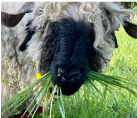
Äußerst hübsch sind die netten Walliser Schwarznasenschafe

Niedlich schauen sie aus mit ihren schwarzen Gesichtern und Ohren, die Walliser Schwarznasenschafe. Es handelt sich hierbei um eine alte Schafrasse, die in