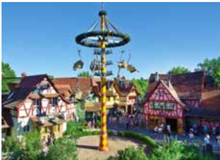
Wenn Sie die Dorfstraße hochschlendern, gelangen Sie direkt zur wunderschön dekorierten Familien-Attraktion „Maibaum“

Zu viel für einen Tag? Das Natur-Resort Tripsdrill bietet außergewöhnliche Übernachtungsmöglichkeiten in komfortablen Baumhäusern und gemütlichen Schäferwagen. Auch hier landete Tripsdrill beim Parkscout Publikums Award in der Rubrik „Beste Ferienparks“ unter den Top 3.