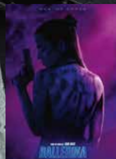
From the World of John Wick: Ballerina ab/am 05.06.2025