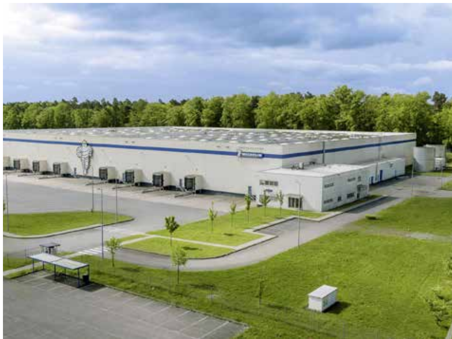
Rund 150 Arbeitsplätze will Viega am ehemaligen Michelin Standort in Kirkel bei Homburg in der ersten Ausbaustufe schaffen