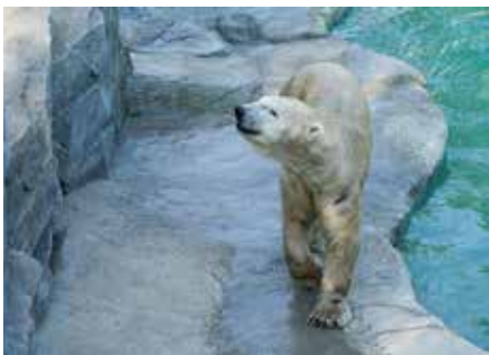
Besuchen Sie gerne auch die Eisbären

sondern werden animiert und motorisiert. Sie bewegen sich, brüllen, atmen... so als würden die Giganten buchstäblich zum Leben erweckt. Dank Soundeffekte und immersiver Szenographie wird eine Atmosphäre geschaffen, die Kinder in den Bann