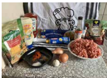
Diese Zutaten benötigt ihr © se

500g Rinderhackfleisch 1 kleine Zwiebel, fein gewürfelt 2-3 Knoblauchzehen, gehackt 1 EL Worcestershire-Sauce 1/2 TL Salz 1/2 TL Pfeffer 1/2 TL Paprika je 1 Esslöffel Majo, Ketchup und Senf 200g Cheddar-Käse