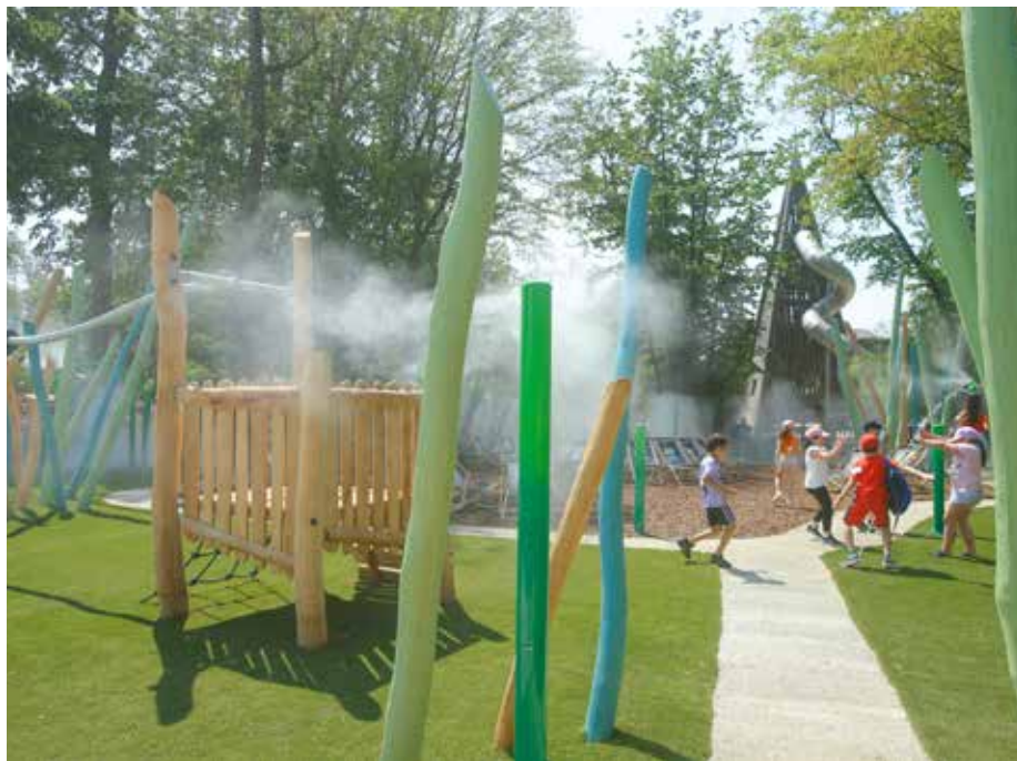
An heißen Tagen sorgt der Wasserspielplatz „Jungle Splash“ für willkommene Abkühlung

Kinder auf den Rücken kleiner, animierter Dinosaurier klettern können, um einen ungewöhnlichen Ausflug zu unternehmen.