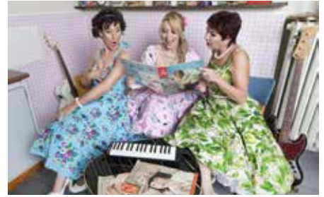
Am 24. Juli bringen die farbenfrohen „Wonderfrolleins“ das Lebensgefühl der 50er- und 60er-Jahre zurück nach Jägersburg

des Museums schweben wird. Wie in den Vorjahren wird bei allen Veranstaltungen auch für das leibliche Wohl bestens gesorgt – an der Klosterruine unter anderem durch die Klosterfreunde. Ein kostenloser Shuttle-Service bringt Besucherinnen und Besucher bequem ab etwa 18.30 Uhr vom Parkplatz der Firma BEGRA zur Spielstätte an der Klosterruine. Die Konzerte beginnen jeweils um 20 Uhr.