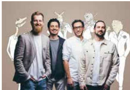
Am Donnerstag, 12. Juni, startet die diesjährige Ausgabe mit dem Chronatic Quartet, das an der Klosterruine in Wörschweiler auftritt

entführen „The Old Friends“ am 26. Juni an der Gustavsburg mit einer liebevoll inszenierten Hommage in die Klangwelt von Simon & Garfunkel. Am 10. Juli folgt das Akustik-Duo „Double Z“ mit feinem Groove im Römermuseum. Zwei Wochen später, am 24. Juli, bringen die farbenfrohen „Wonderfrolleins“ das Lebensgefühl der 50er- und 60er-Jahre zurück nach Jägersburg. Am 7. August kehrt Marcel Adam mit seinem Trio und einer Mischung aus Chanson, Witz und Gefühl an die Klosterruine zurück. Den Abschluss bildet am 21. August das Trio „Morley“ im Römermuseum, dessen dreistimmiger Harmoniegesang durch die besondere Atmosphäre