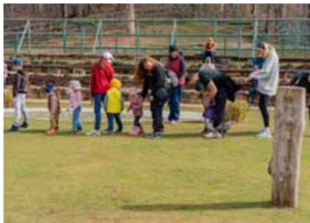
In der Flugshow darf auch das Publikum mitwirken