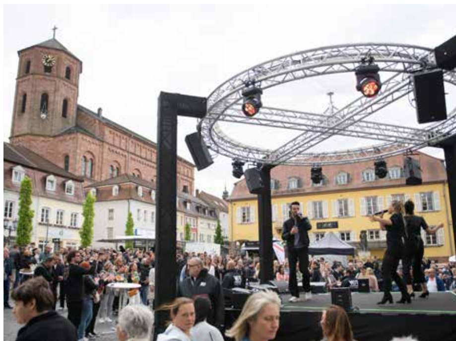
Ein voller Marktplatz und eine schicke Kulisse.