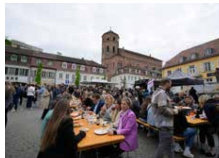
Viele Bürgerinnen und Bürger, aber auch die Belegschaft von Dr. Theiss Naturwaren genossen die Feier auf dem Marktplatz.

Anwesenden. Später stellte er Lieder seines neuen Albums „La Discoteca Italiana“ vor und gewährte mit dem Song „Confusione“ sogar eine exklusive Vorpremiere eines TV-Beitrags, der erst am nächsten Tag ausgestrahlt werden sollte. Dabei suchte Zarrella immer wieder den direkten Kontakt zum Publikum, sprach Menschen ge-