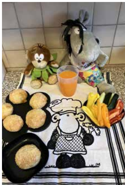
Lasst euch unsere leckeren Knoblauch Parmesan Cheeseburger Bomben schmecken

und dann ausrollen, teilt ihn in 12 gleich große Stücke. Stellt die Füllung, Soße und den Cheddar-Käse bereit. Jetzt nehmt ein