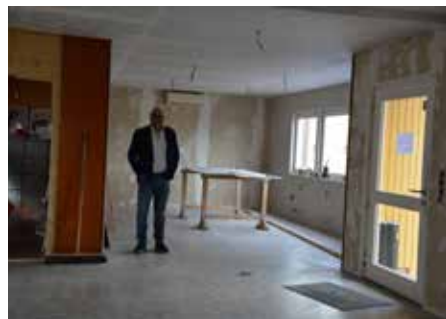
Die Baustelle im Ostring lässt vermuten, wie großzügig und schön die neuen Räumlichkeiten werden

Hier steht Ihnen Thomas Felden mit seiner umfangreichen Erfahrung bei allen Fragen rund um Kredite, Tagesgeld, Geldanlage in Investmentfonds, Bausparen, Immobilienfinanzierung, Vermögens- und Kidspolice zur Verfügung. Sie fragen sich, was eine Kidspolice ist? ERGO beschreibt dies so: „Ein Stück Zukunft für Ihr Kind – Vorsorge