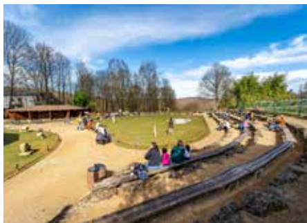
Ein Besuch in der Falknerei im Neunkircher Zoo lohnt sich immer

- Zauberkunst zum Staunen - Ein Auftritt des Kinderchors - Überraschungsstationen im gesamten Zoo – darunter Kinderschminken, interaktive Robotik zum Mitmachen und kostümierte Heldinnen und Helden von „Helden für Herzen“ - Selfies