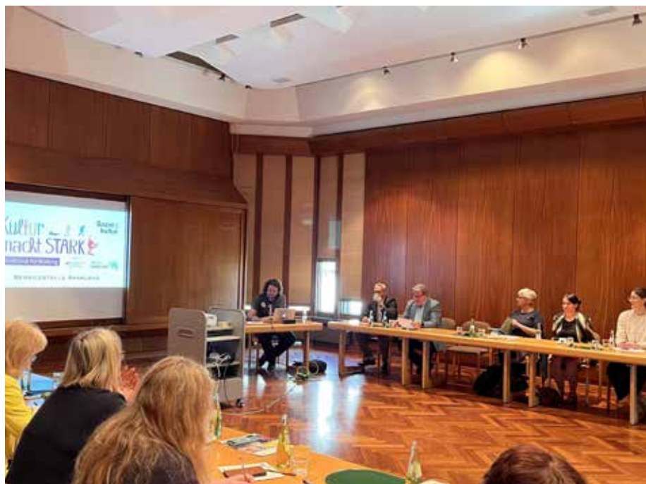
Teilnehmende aus der gesamten Region folgten der Einladung ins Homburger Rathaus – mit dem gemeinsamen Ziel, Kunst und Kultur für Kinder und Jugendliche zugänglicher zu machen

zeigte sie anschaulich, wie Museen zu lebendigen und partizipativen Lernorten für Kinder und Jugendliche werden können. Besonders lebendig wurde es in der offenen Vorstellungs- und Fragerunde: Hier kamen alle Teilnehmenden zu Wort, stellten ihre Arbeit vor, tauschten Erfahrungen aus und vernetzten sich miteinander. Die Vielfalt der vertretenen Bereiche und Perspektiven machte deutlich, wie groß das gemeinsame Potenzial für neue Projekte ist – und wie wichtig eine gute Zusammenarbeit vor Ort ist. Ein großes Thema war die Frage, wie komplexe kulturelle Inhalte kindgerecht vermittelt werden können und wie sich strukturelle Hürden, wie etwa