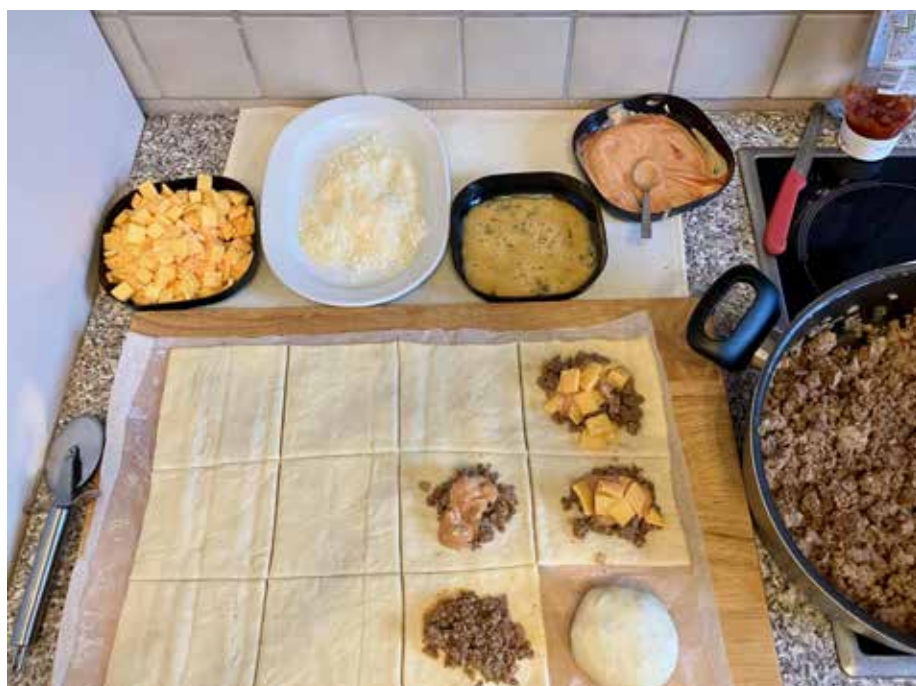
Nun geht es ans Füllen und Formen der Teigstücke