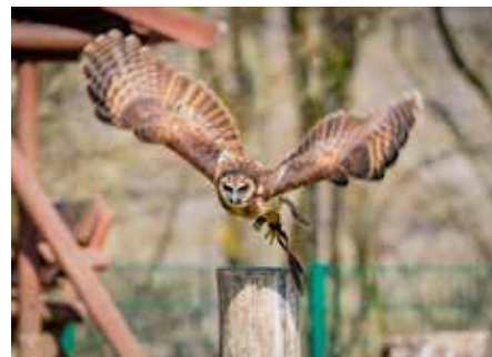
Freuen Sie sich auf einen schönen Tag in der Zoofalknerei