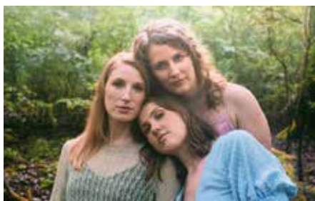
Den Abschluss bildet am 21. August das Trio „Morley“ im Römermuseum

verschmelzen und Bon Jovi gemeinsam mit Sebastian Bach auftreten - ein idealer Auftakt für die diesjährige Konzertreihe. Bis zum 21. August folgen sechs weitere Konzerte an drei Homburger Spielstätten – der Gustavsburg in Jägersburg, dem Römermuseum Schwarzenacker und erneut der Klosterruine. Auch 2025 setzt das Kulturamt auf Vielfalt und Qualität. Norbert Zimmer hat ein Programm auf die Beine gestellt, das sowohl musikalische Klassiker als auch neue Klangerlebnisse umfasst. So