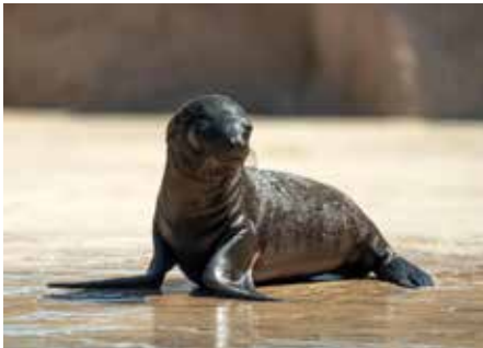
Der kleine Seehund freut sich über das kühle Nass

Hierfür wurde ein neuer, rund 200 Meter langer Rundgang in einem bislang unzugänglichen Waldbereich des lothringischen Zoos angelegt, auf dem fast 70 Dinosaurier in Lebensgröße ausgestellt sind. Und damit der Rundgang wirklich zum Abenteuer für Familien wird, stehen die Saurier nicht einfach nur starr im Wald,