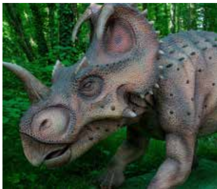
Kommen Sie mit auf eine Zeitreise durch die verlorene Welt der gigantischen Urzeittiere

Bar einlegen, einem geselligen, schattigen Bereich, in dem man sich inmitten der Jurassic-Welt entspannen kann. Mit „Jurassic Expedition“ widmet sich der Zoo von Amnéville dem Auftrag, seine Gäste für Tier- und Naturschutz zu sensibilisieren, zu informieren und zu unterhalten. Stauen, Lernen und Vergnügen wird in Einklang gebracht, so dass sich der Ausflug für Groß und Klein lohnt. „Jurassic Expedition“ ist in der regulären Eintrittskarte für den Zoo enthalten. Das Event startet am Wochenende des 25. Mai 2025 und läuft bis Jahresende. Ein gemütlicher Zoobesuch ist vor oder nach der „Jurassic Expedition“ möglich!