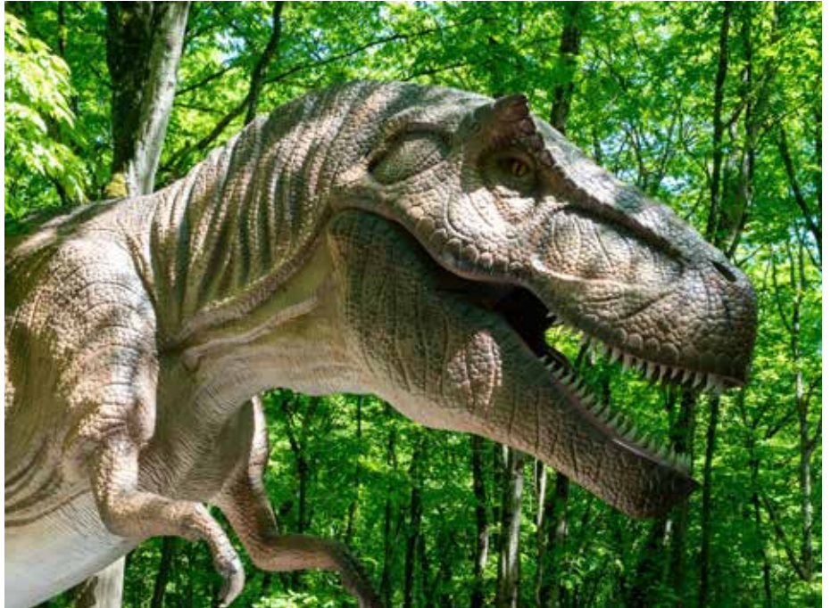
Damit der Rundgang wirklich zum Abenteuer für Familien wird, stehen die Saurier nicht einfach nur starr im Wald, sondern werden animiert und motorisiert

zieht und trotzdem erstaunlich realistisch erscheint. Der Höhepunkt während des Rundgangs durch den „Wald der Dinosaurier“ ist ein 23 Meter langer und über 10 Meter hoher Artgenosse. Diese beein-