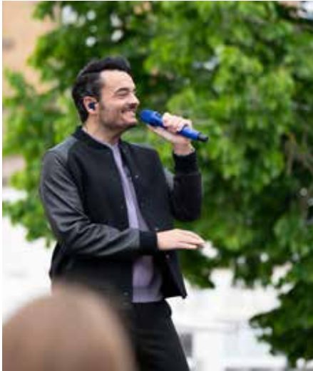
Der Star bei seinem Auftritt auf dem Historischen Marktplatz Homburg.

zielt an, scherzte, motivierte, tanzte und ließ den Abend zu einer echten Feier der deutsch-italienischen Lebensfreude werden. In ruhigen Momenten zeigte er sich nachdenklich und ehrlich, etwa mit dem