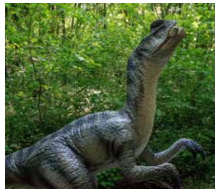
Dino-Fans aufgepasst: Ab 25. Mai startet im Zoo von Amnéville die neue, immersive Attraktion „Jurassic Expedition: Der Wald der Dinosaurier“

Denn tatsächlich waren nicht alle Dinosaurier Giganten! Während die Kinder auf Entdeckungsreise gehen, können die Eltern eine wohlverdiente Pause in der Jurassic